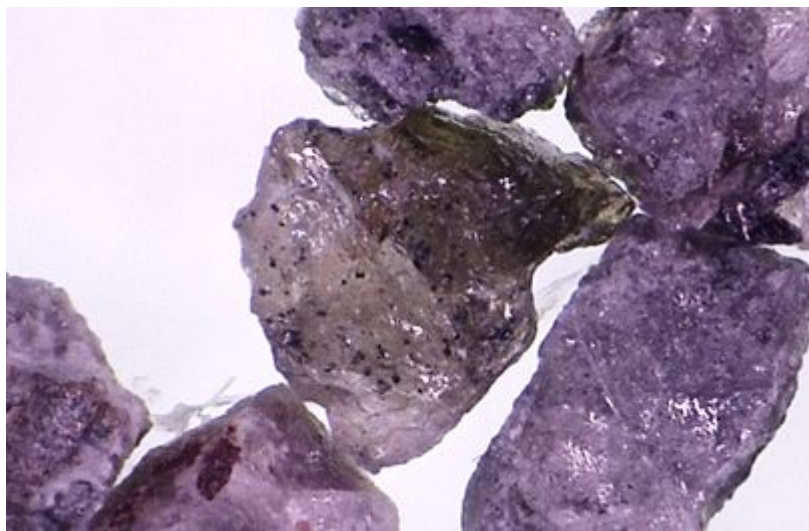
図 2. 2020 年 2 月 3 日噴出物に少量 (数%程度) 含まれる、ガラス光沢を有する粒子.