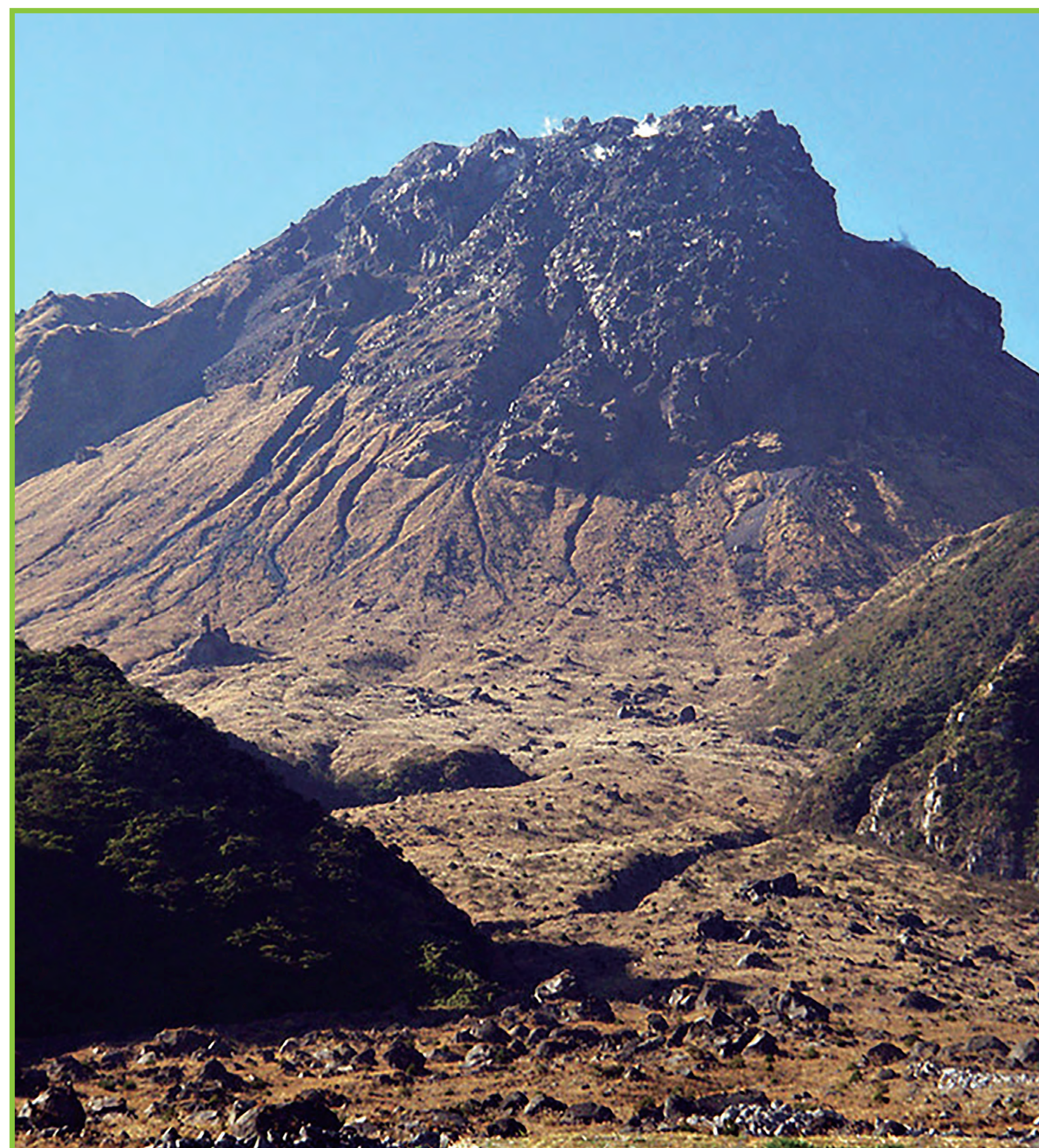
写真1 最近の平成新山 (2007年11月)