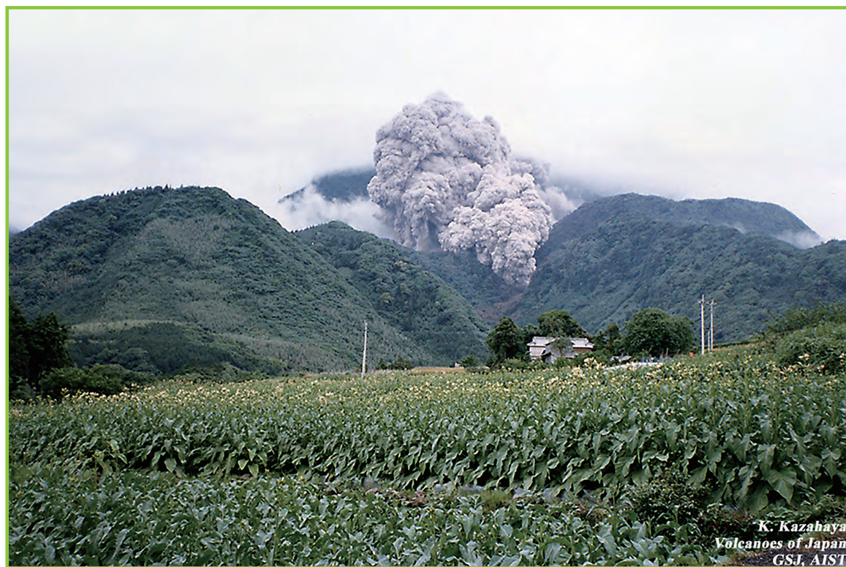
写真2 1991年5月29日の火砕流