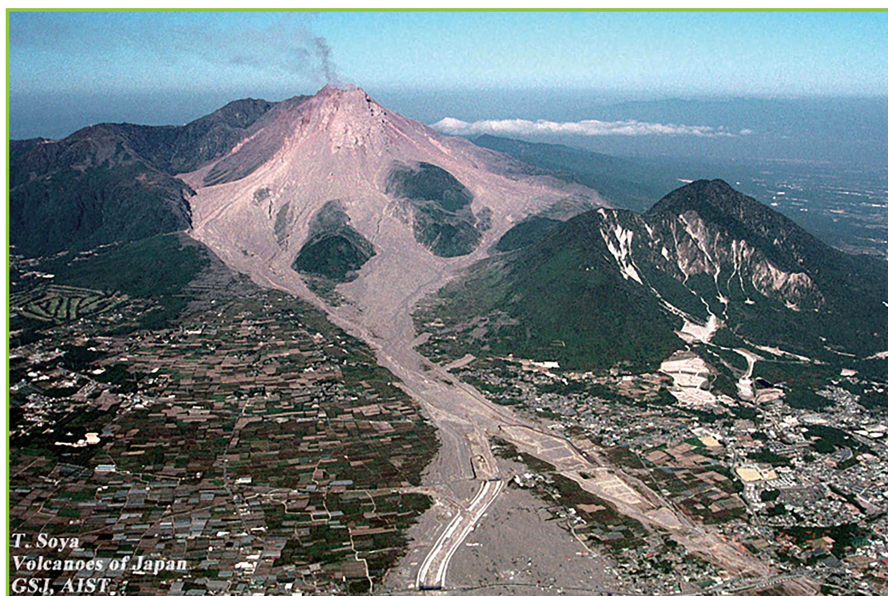
写真3 南東側からみた平成新山と火砕流堆積物 (1994年10月)