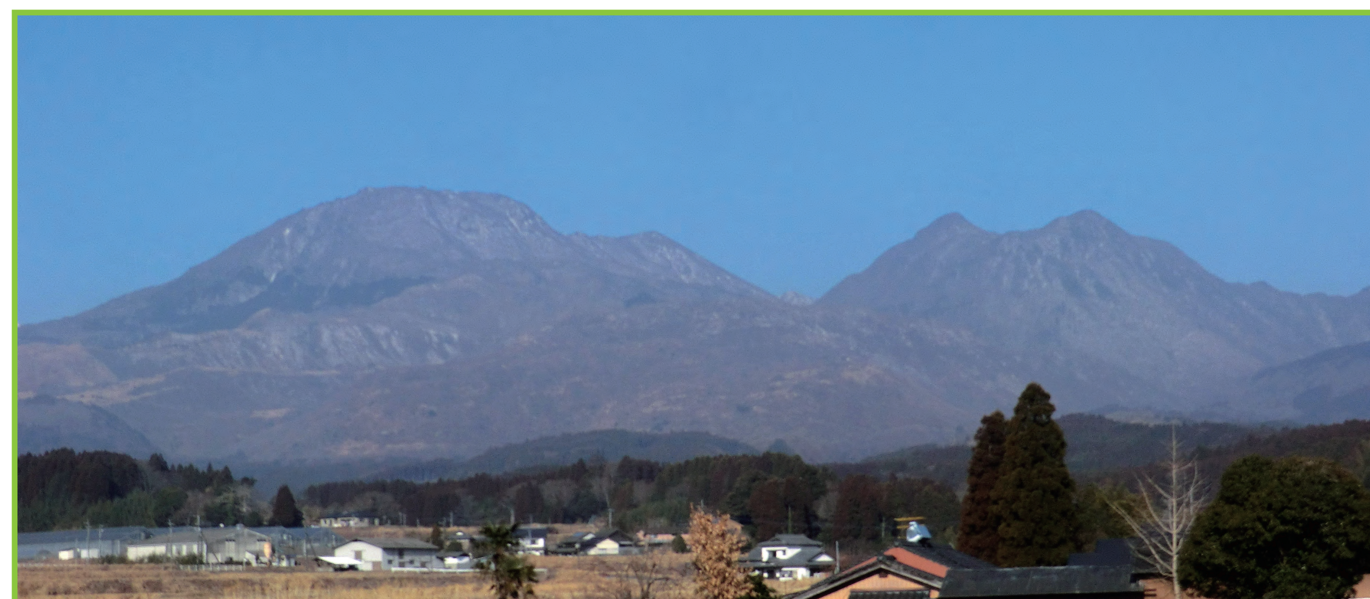
写真4 大船山（左）と黒岳。大船山は厚い溶岩流からなる成層火山、黒岳は溶岩ドームです。