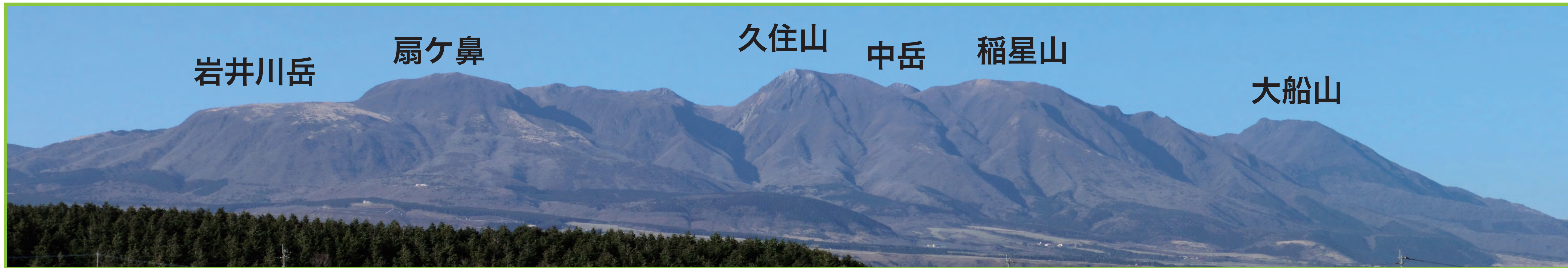
写真1 南麓から見た九重山