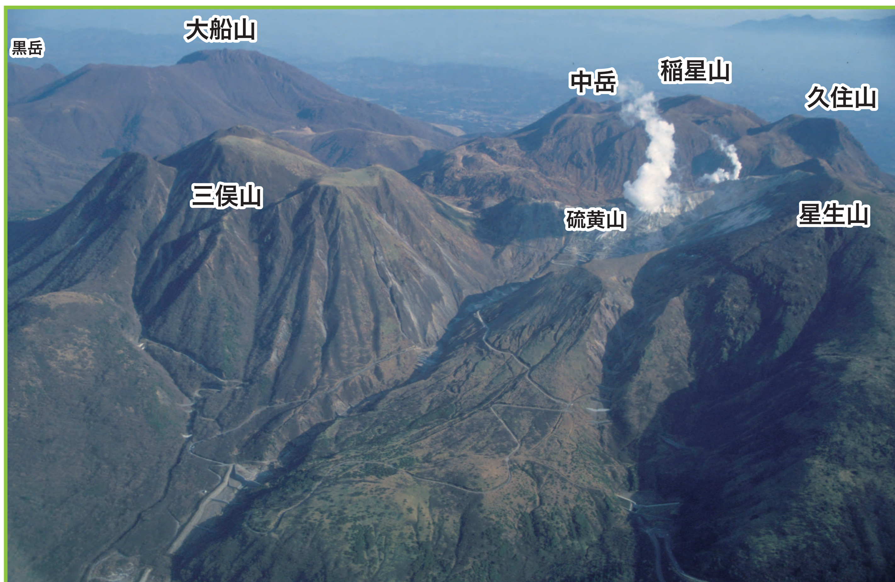
写真3 空から見た九重火山。中央やや右の大きな白い噴煙は硫黄山の噴気帯から、すぐ右側の小さな噴煙は1995年火口からの噴煙。