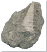
新生代 巻貝(ヒカリヤ)