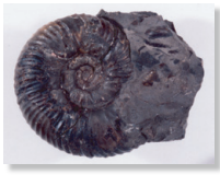
中生代 アンモナイト