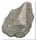
新生代 巻貝(ビカリヤ)