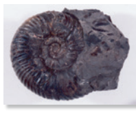
中生代 アンモナイト