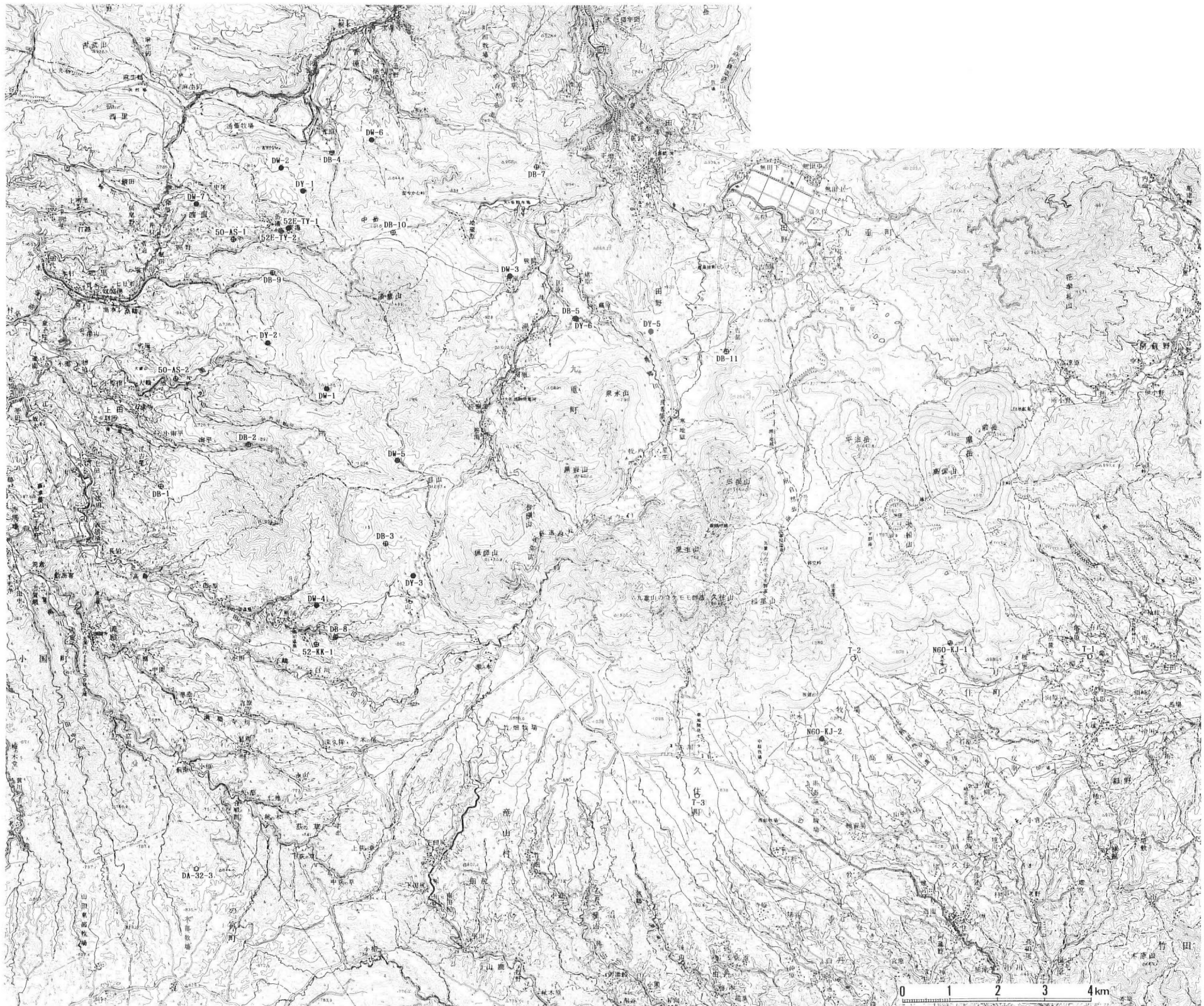
第2-2-Ar5図 地域No.5坑井位置図。本図は国土地理院発行の5万分の1地形図「森」,「宮ノ原」および「久住」を使用したものである。