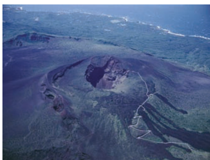
写真2 伊豆大島三原山火口。