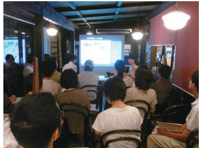
写真 90分間内容の濃いお話。

生活者の視点で身近なことから疑問があれば探求し、変えて行く勇気を持つことが大切だ、という自然科学を超えたメッセージをこの夜学でいただいたように思いました。