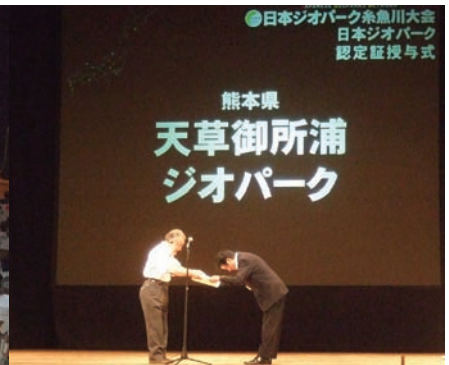
写真3 認定証授与式。