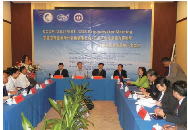
写真 オープニングセレモニーの様子。