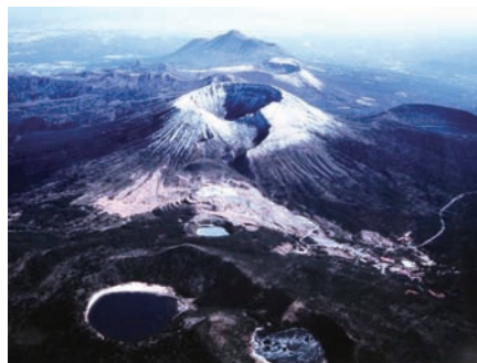
写真1 霧島連峰。

速報! 2009年12月にGGNへ加盟申請を行っていた山陰海岸ジオパークは、2010年10月1日から開催のギリシャ・レスボス島でのヨーロッパジオパーク会議において、加盟が認められました。今回の会議では、世界から山陰海岸を含む11地域の加盟が認められ、これにより、世界ジオパークは、日本の4地域を含む25カ国77地域となりました。