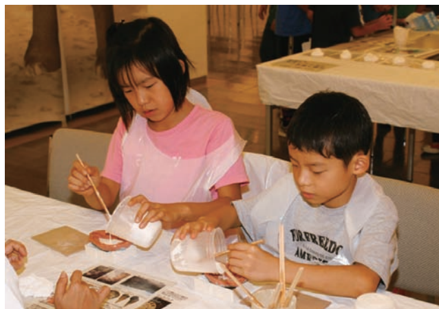
写真 丁寧に石膏をアンモナイト型に流し込んでいます。

リカ作りを体験してもらうことが出来ました。そのうち、アンモナイトは208個(個人では79個)、ビカリアは61個、三葉虫は42個の作成個数でした。レプリカの作成者がここ数年よりも少なかったこともあり、少し寂しく感じられましたが、その分個人に十分な体験時間があり、じっくりと化石の解説なども聞いてもらえたと思います。例年では、初日に参加した小学生が連日リピーターとして来てくれることが多かったのですが、今回はリピーターが少なかったと感じられました。ただ、19日には会場地区の市民運動会があったにもかかわらず、運動会の出番の合間に何度もレプリカを作りに来てくれた子供が何人もいてくれたのは嬉しく感じました。レプリカ作りを指導してくれた補助スタッフにこの場を借りて御礼申し上げます。