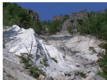
写真3 白滝十勝沢黒曜石露头。