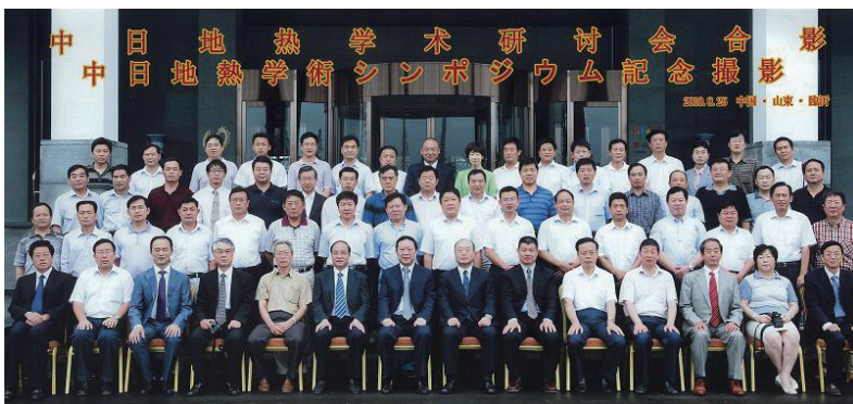
写真 参加者の集合写真。

午後には諸城県に建設途中の恐竜博物館を特別に見学させて頂いた。おびただしい恐竜の骨の化石が埋もれており、その規模は世界