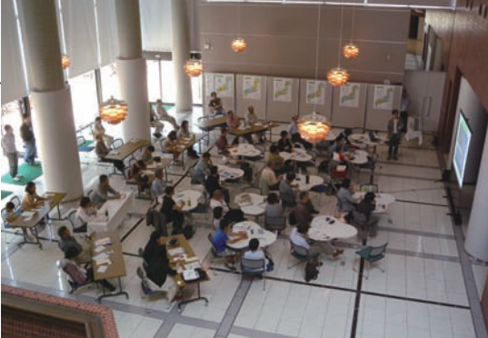
写真1 会場風景：日曜日の午後，共用講堂 ホワイエで。