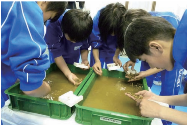
写真 水晶拾いに熱中する中学生たち。皆さん真剣です。

イベント当日は館内の多目的展示室において、午前10時から1回15分で、合計20回的水晶拾いを行いました。