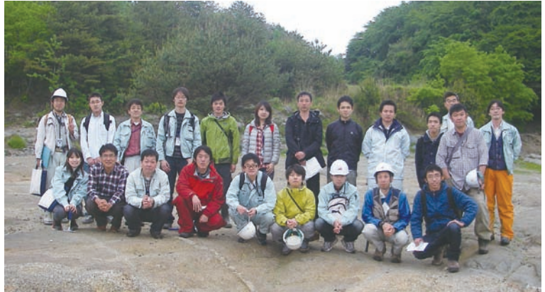
写真 桃山にて。