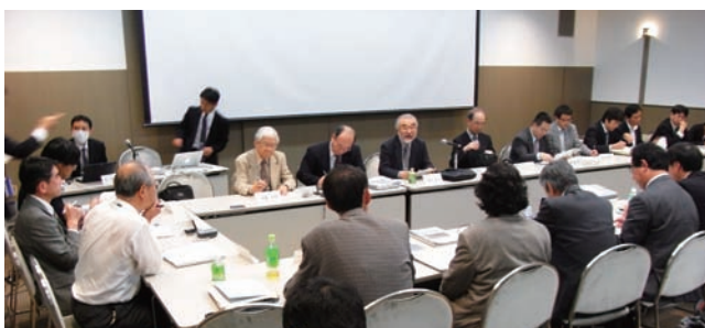
写真2 第8回日本ジオパーク委員会の様子。

ての試みとして、千葉幕張メッセ国際会議場で開催の日本地球惑星科学連合大会初日である5月23日（日）に、一般セッション「ジオパーク」において、公開プレゼンテーション形式で審査を行いました（写真1）。