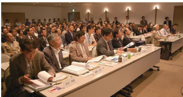
写真1 公開プレゼンテーションの様子。

日本ジオパーク委員会（JGC）の2010年応募は4月26日に締切られ、世界ジオパーク申請候補2地域（室戸、阿蘇）、日本ジオパーク候補3地域（白滝、伊豆大島、霧島）から申請がありました。申請書を受理したJGCは審査のためのプレゼンテーションを行います。今年度は、初め