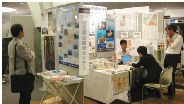
写真 ブース展示の様子。

5月23日から28日にかけて幕張メッセ国際会議場にて日本地球惑星科学連合2010年大会が開催されました。地質調査総合センター(GSJ)では例年どおりブース展示を2Fホールにて行いました(写真)。用意したパネルは、地質の日、ジオパークに関するものと、各ユニット、陸域地質図幅プロジェクト、沿岸海域の地質・活断層調査プロジェクト、地質標本館などの内容紹介でした。その他、地質図(4枚)、標本館特別展、化石アトラスのポスターを貼りだし、産総研、GSJのパンフレット数種を設置しました。そのうち化石アトラスのポスターを無料配布したとこ