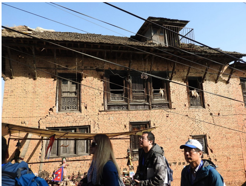
写真3 レンガが少しずれてしまった家.

巡検は、盆地東縁の丘に位置するチャングナラヤン (Changu Narayan) の丘から盆地を展望することから始まりました (写真2)。