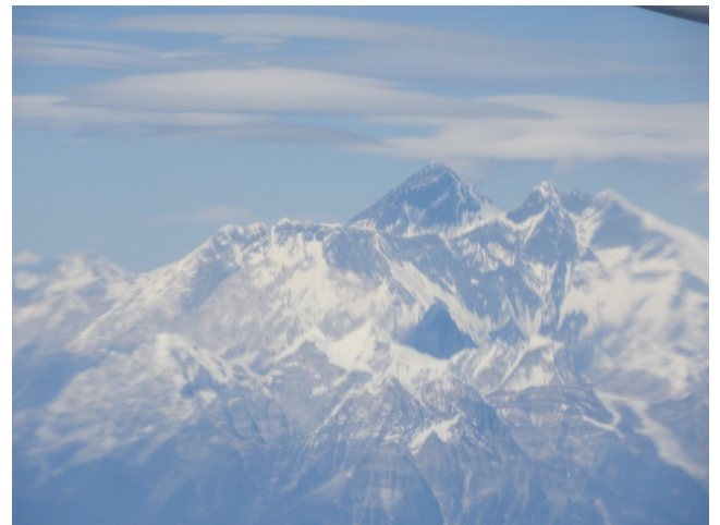
写真 19 帰途、飛行機から見たヒマラヤ山脈。