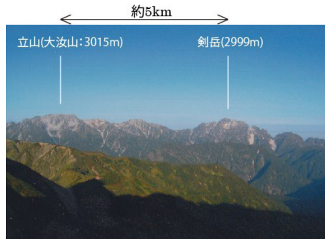
写真 17 北アルプス・立山連峰の景観 (写真 16 と比較してください。)

私は、今まで述べてきたようにヒマラヤと日本の違いに目を向けがちでした。しかし、ネパールヒマラヤを調べてこられた長谷川先生はさすがに冷静です。両者の共通点は、長谷川(2017)に要領よくまとめられています。