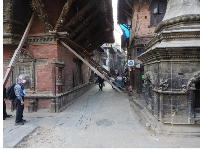
写真 10 つっかい棒で支えられた建物（パタンにて）。