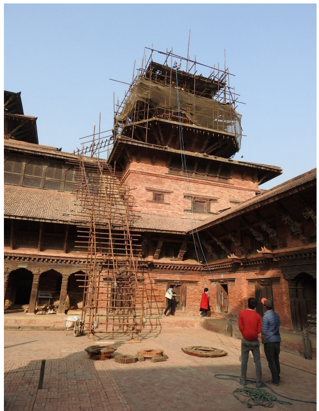
写真7 修復中のパタン(カトマンズの南約10 km)の王宮。