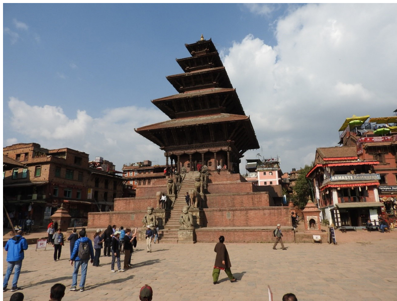
写真 4 被害が軽微だったニャタポラ寺院。