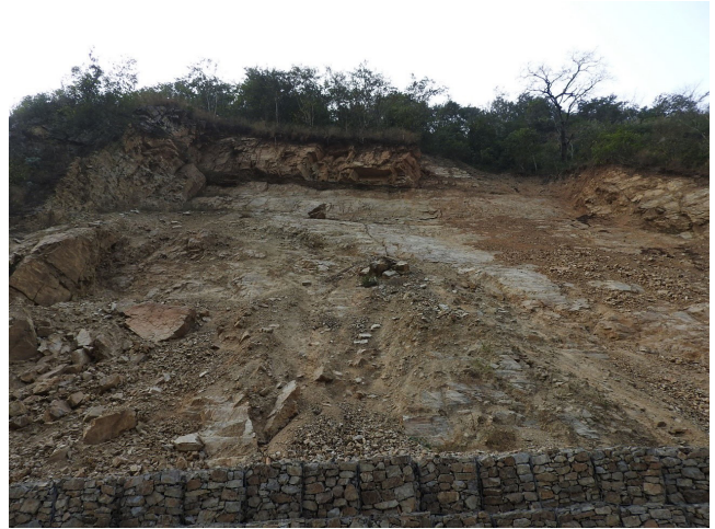
写真 13 クリシュナビール地すべりの現況。

味深く感じました。長谷川先生とともに引率して下さったランジャン先生（トリブヴァン大学）によれば、氷河湖の決壊に伴ってトリスリ川を流下した巨大土石流と、その後の掃流的な流れに伴う河川成の堆積物によって、厚い堆積物からなる堆積段丘が形成されたと考えられているとのこと。確かに段丘堆積物の下部は基質支持の不淘汰な塊状の層相を示す、多種の礫からなる礫層でできております。この堆積段丘はトリスリ川沿いに長く連続するもので、いつの時代に形成されたものか大変興味深く感じました。