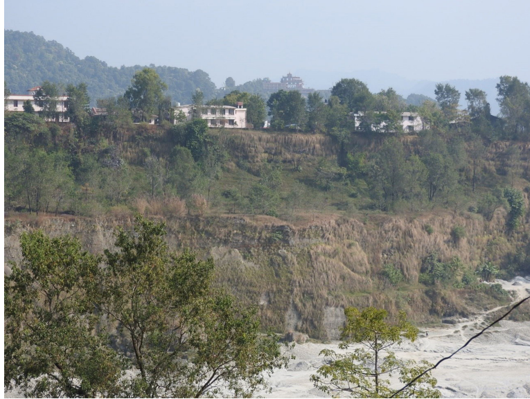
写真 18 最終氷期の湖成段丘と後氷期の河成段丘を開析するセティ川の現河床。

ように第四紀火山とは無関係ながら高い熱流量を反映した温泉が見られますが、ネパールにも特に MCT などの大断層沿いに、火山とは無関係な構造規制型の温泉が数多く存在するとのことでした。