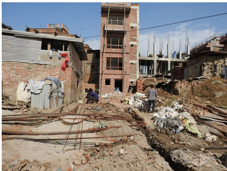
写真 5 バクタプル市街の建築中の家。