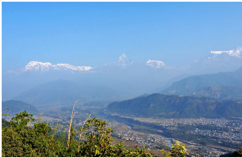
写真 15 サランコットの丘(西峰)から眺めるアンナプルナ連峰とセティ川の段丘 左の白い峰がアンナプルナ I 峰(8,091 m)、中央の青い三角錐の峰がマチャプチャレ(6,997 m)、 右端の白い峰がアンナプルナ II 峰(7,937 m)。

会議後の巡検で得たもう一つの大きな収穫は、長谷川先生が強調されていたヒマラヤと日本 - 特に西南日本弧 - との共通性についての認識を持つことができたことでした。日本の中で第四紀地殻変動と関連する現象を記載してきた