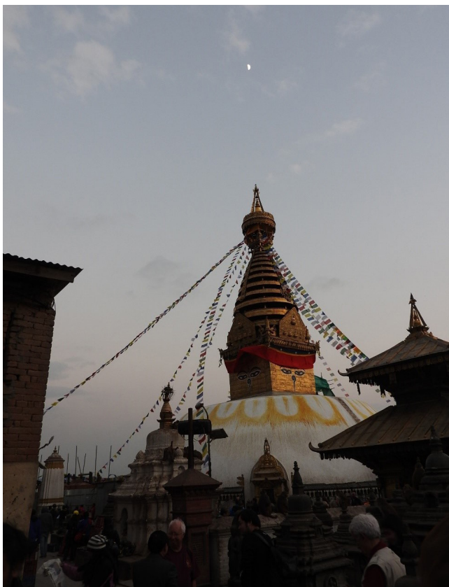
写真6 スワヤンブナートの夕暮れ。

カトマンズとネパール第2の都市ポカラを結ぶ道路はミッドランドを走り抜けるネパール第一の主要道路です。この道路はプリティブハイウェイ (Prithive Highway) と呼