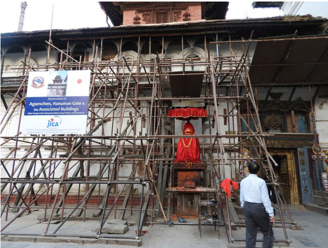
写真 9 国際的な支援を受けて修復されつつあるカトマンズ・ダルバール広場の旧王宮（ハヌマン・ドカ：Hanuman Dhoka）。