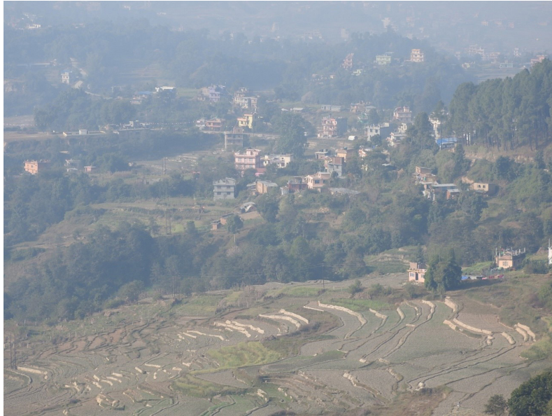
写真2 チャングナラヤンの丘から見たカトマンズ盆地.