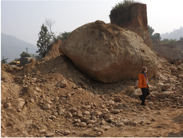
写真 12 トリスリ川の堆積段丘堆積物中の巨大な円礫。