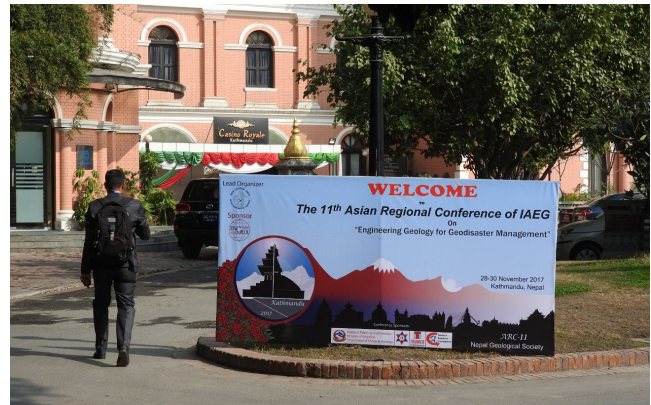
写真1 カトマンズを代表する5つ星ホテル「ホテル・ヤク・アンド・イエティ」で開催された IAGG-ARC11。

国際応用地質学会アジア地域会議 (International Association for Engineering Geology Asian Regional Conference) は、1992 年の IGC (国際地質学会議) 京都大会において開催が呼びかけられ、1997 年に東京で最初に会議が開催されて以降、アジア諸国の持ち回りで 2 年おきに開催されています。アジア地域会議と銘打っていますが、例会にはアジア以外にも多くの技術者・研究者が参加します。2017 年カトマンズ大会 (IEAG-ARC11) ではヨーロッパ諸国や南北アメリカ大陸諸国、オセアニア諸国および南アフリカからも参