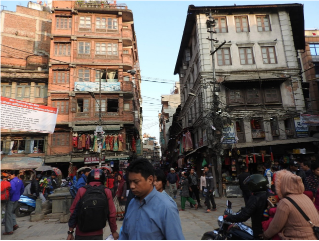
写真 8 カトマンズの下町（インドラチョーク：Indra Chowk）の町なみ。地震被害はそれほどなかったと聞きました。