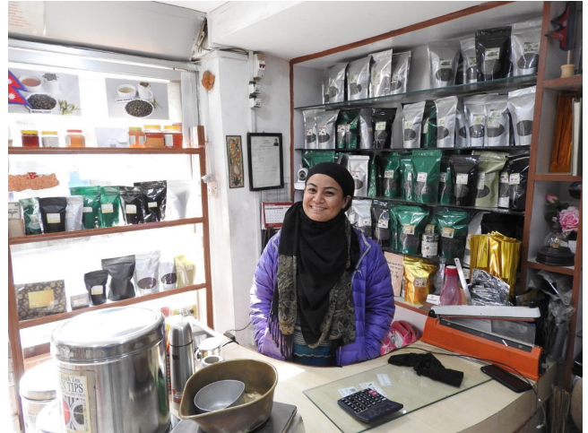
写真 11 カトマンズのお茶屋のおばさん。