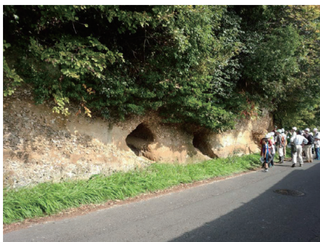
第7図 崎浜横穴古墳の側方にみられる、大規模な化石カキ礁（観察地点3）。