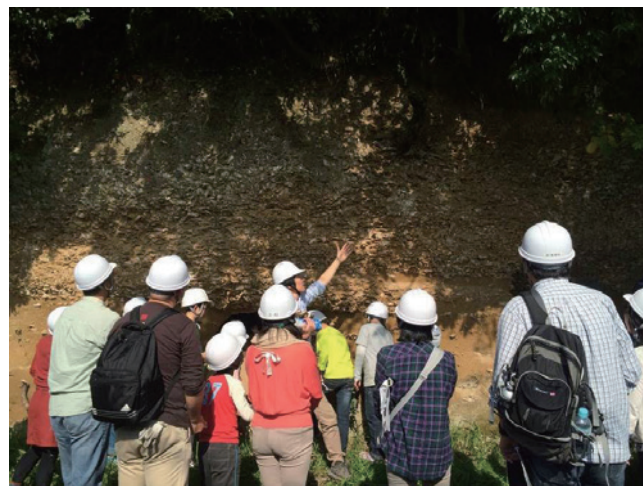
第8図 化石カキ礁の露頭の前で、説明を聞く参加者（観察地点3）。みなさん熱心に聞いています。

御さんと化石の同定作業をしている子供の姿も見られました（第4図）。採集後は、配付資料の古東京湾の説明資料を用いながら、観察地点1の地質の説明を行いました。すぐ目の前に淡水の湖である霞ヶ浦が広がっているにもかかわらず、海に生息した貝化石が採集されることで、この陸上にまで、過去には海が広がっていたことを認識してもらいました。