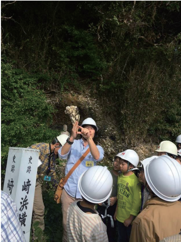
第9図 現生のカキ殻を用い、カキの生息姿勢について説明（観察地点3）。

8図)。ここは昔から、“出島のカキ礁”として知られている地点で、これまでの野外観察会でも何度も訪れています。約70mの側方への広がりがある化石カキ礁の塊であり、このカキ礁を基盤として横穴が掘られ（第7図）、古墳としても知られています（崎浜横穴古墳群）。このカキ礁におけるカキ化石の産状として、垂直に並んだカキ殻が上方に固着して伸びるような自生的な産状と、殻が横倒しになって積み重なった他生的な産状が観察できます（横山ほか，2004）。今回は、現生のカキ殻を持参し、カキの生息姿勢について説明しました（第9図）。一般にカキというと養殖のカキしかイメージできない方がほとんどですが、カキ礁という言葉を知った方や、カキの本来の生活形態を初めて知ったという参加者がほとんどでした。本観察地点の前の道路はやや狭いため、露頭観察の際、道路側に参加者がはみ出さないように注意し、声かけをしながら、露頭観察を行いました。