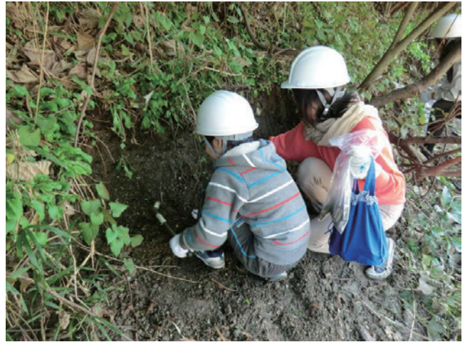
第3図 ねじり鎌で露頭を削る参加者親子（観察地点1）。