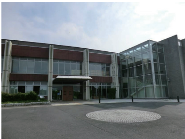
第5図 茨城県霞ヶ浦環境科学センター外観。