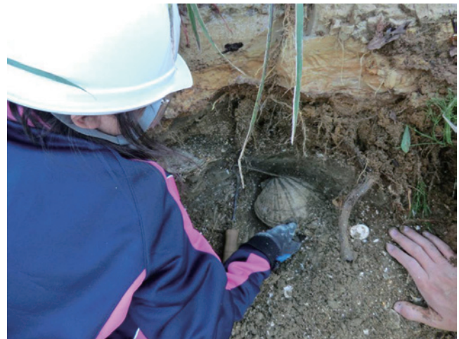
第11図 大きな貝化石（トウキョウホタテ）を露頭から採集する参加者（観察地点4）。この場所からはトウキョウホタテ数枚が重なり合って発見され、ほぼ破損のない化石を採集することができました。