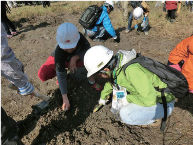
第2図 観察地点1にて、地面を掘る参加者と国立科学博物館スタッフ。