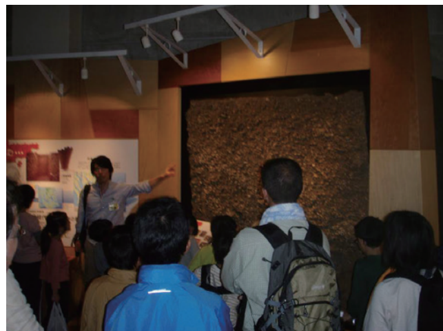
第6図 上高津貝塚の剥ぎ取り展示前にて、説明する産総研スタッフ（観察地点2）。