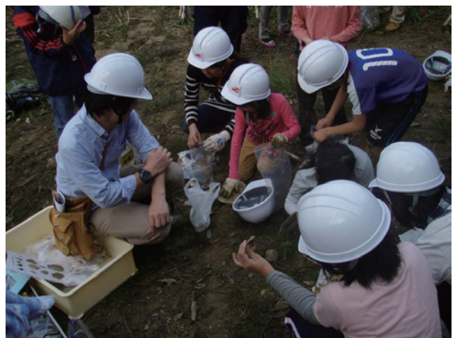
第12図 産総研スタッフと採れた化石貝類の同定を行う参加者（観察地点4）。みなさん、興味津々です。