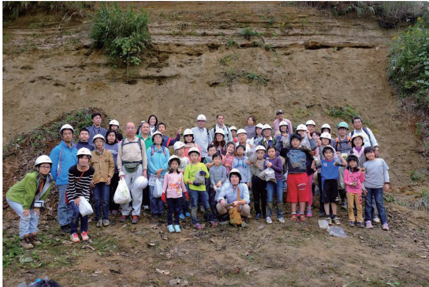
第 13 図 観察地点 4 の地層を背景に記念写真。みなさんの満足した顔が印象的です。

だ、今回の参加者は小学生が多く、堆積構造の観察やそれに基づく環境推定などは難しいと判断し、貝化石の採集に集中してもらうことにしました。崖は急ではないのですが、砂から構成されているので、足場をしっかりと作らないと滑りやすくなかなか登れません。化石が見える層準はある程度崖を登らなければいけない高さなので、最初は皆さん苦労していました。しかし、一度自分のターゲットとする層準を決めて足場を作ってしまうと、ねじり鎌を使った化石採集に没頭していました(第 10, 11 図)。参加者から“この貝化石は本当に化石ですか?”と何度か聞かれました。海でとれる現在の貝殻とほぼ保存状態が変わらず、疑問に思う気持ちはよくわかります。化石の定義は決まっておらず、石化していなくても自然に堆積物に埋没された生物遺骸は化石として扱われることが多く、そのような説明を行いました。