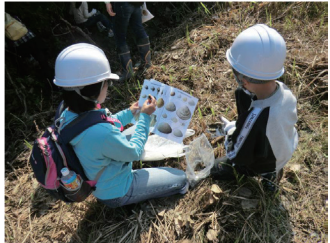
第4図 配布資料を見ながら、採集した貝類の同定を行う参加者（観察地点1）。

朝9時にTXつくば駅で集合した参加者を乗せた大型バスは、その後地質標本館でも参加者と案内者を乗せ、最初