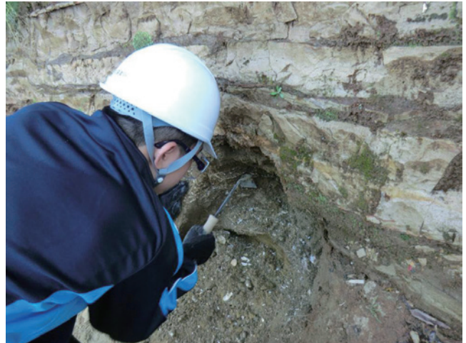
第10図 ねじり鎌で露頭を削る参加者（観察地点4）。

地質標本館の野外観察会で訪れるのは初めてですが、この地点も有名な崖で、学会などの巡検でもよく使われている場所です。約20mの高さの崖からは、貝化石が多産し、また浅海環境における多様な堆積構造が観察できます。た