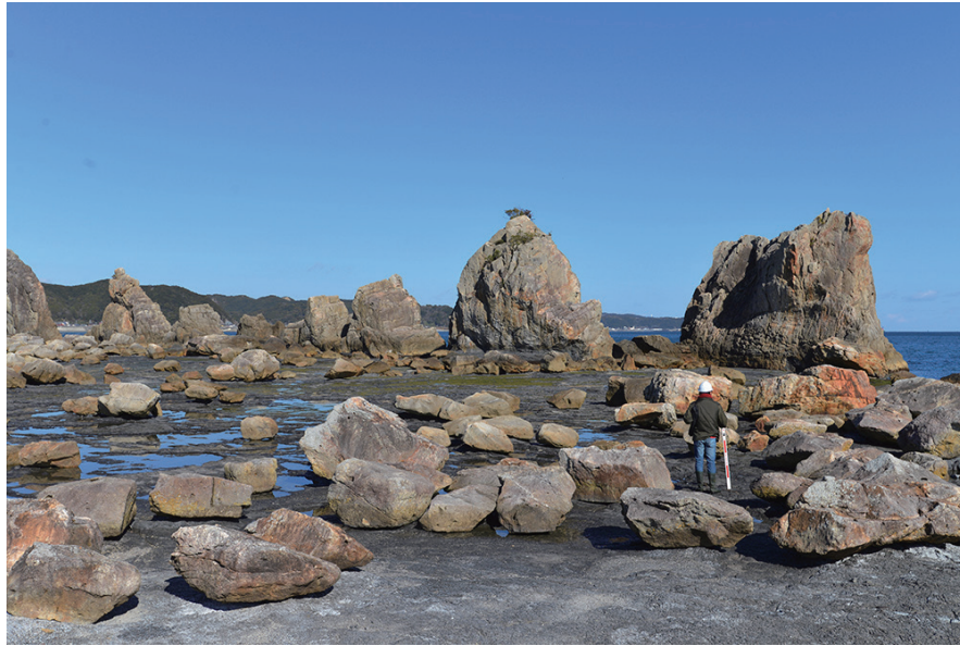
写真1 和歌山県串本町の名勝橋杭岩周辺に散らばる漂礫群。これらは南海トラフ沿いの過去の巨大地震に伴う津波で運ばれたと考えられる。

た。そこで震災後も引き続き各地で精力的に調査・研究を行っており、下北半島、房総半島や後述する南海トラフ沿いなどを重点的に調査して新たな知見が得られつつあります (Tanigawa et al. , 2014 など)。