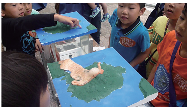
写真4 桜島模型から噴出するトマトジュースマグマ。

岩がどのようなところを流れ下るか、一連の様子を観察することができる。この装置ではトマトジュースマグマの発泡剤として重曹とクエン酸を混ぜたものを用いた。マグマ溜まりとしてのビニール袋が発泡により浮き上がらないようにするため、「実際のマグマだまりにも鉱物の結晶と呼ばれる宝石が入っているのですよ」と説明しながら、かんらん石に見立てた黄色のビー玉や斜長石に見立てた透明のビー玉を重りとして入れた。水より比重が大きいトマトジュースマグマは発泡しなければ上昇することはない。しかし、発泡が始まるとペットボトル火山で用いた入浴剤よりも激しく反応が起こり、勢いよくトマトジュースマグマが上昇した。水槽上の火山模型火口では、連続的な溶岩流噴火から徐々に間欠的なストロンボリ式噴火へと移行し、噴火の時間変化も見られた。また、一旦噴火が始まると、水圧の効果かペットボトル火山より長く噴火が続いていたように見えた。子供たちは噴出した溶岩が模型上をどのように流れるかということに興味を持つのではないかと予想していたが、水槽内のマグマ上昇の様子を熱心に観察する子