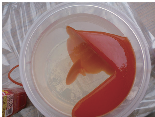
写真2 ゼリー内に形成された2方向の脈。