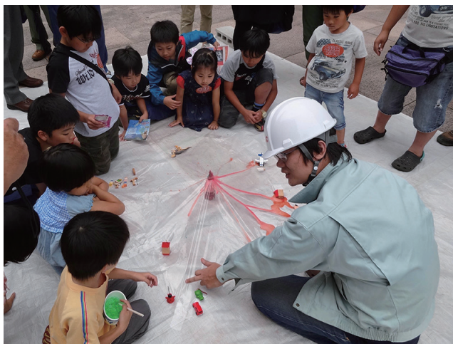
写真3 ペットボトル火山から噴出したトマトジュースマグマが家を飲み込む。

ペットボトル火山と同様に発泡による噴火装置であるが、ペットボトルをビニール袋に代えて水を張った水槽内に沈めることで、比重や水圧の効果を含めて観察できる装置である。水槽の上には桜島火山の石膏模型を設置し、マグマ溜まりからのマグマの上昇と火口での噴出、そして溶