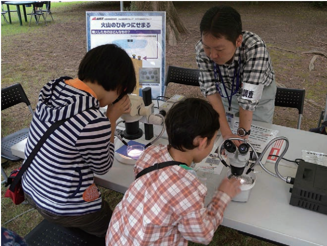
写真5 試料に触れながら注意深く火山灰を観察する参加者。

供が多かった（写真4）。物が重力に従い流れることは日常生活で目にすることがあるが、上昇するという現象は非日常的であり、興味を惹かれたのかもしれない。