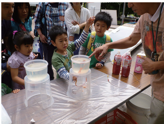
写真1 サイフォンでゼリー内にトマトジュースマグマを注入する様子。

ース）が上昇する様子を観察し、岩脈形成の様子を理解してもらう装置である。1リットルほどの透明容器に固めたゼリー内に、底部に開けた穴からトマトジュースマグマを注入し、サイフォンの原理でマグマを上昇させる。参加者には注入時に気泡が入らないように注意しながらサイフォンを操ってもらい、あらかじめ切れ目があるわけでもないタネも仕掛けもないゼリー内を、トマトジュースマグマが脈状に上昇する不思議さを体験してもらう（写真1）。注入途中で容器を両側から押すなど応力を加えると、それに応じて切れ目の形も変化する。多くの場合は斜めに脈が入り、時には2方向に脈ができることもあった（写真2）。この実験では、ゼリーの比重は砂糖の濃度で調整可能であり、注入溶液をコーラ等に代えたりすることで、ゼリー表面に達したときの噴出の様子にも変化が与えられる。小学生には少し難しい内容であったかもしれないが、切れ目を形成しながら流体が上昇の様子は中学生や大人にとっても大変興味深く、お父さん方が嘆息をもらしながら写真を撮る姿が印象的だった。今回は28セットのゼリーを準備し、約1時間おきに2セットのペースで実施し、最後に