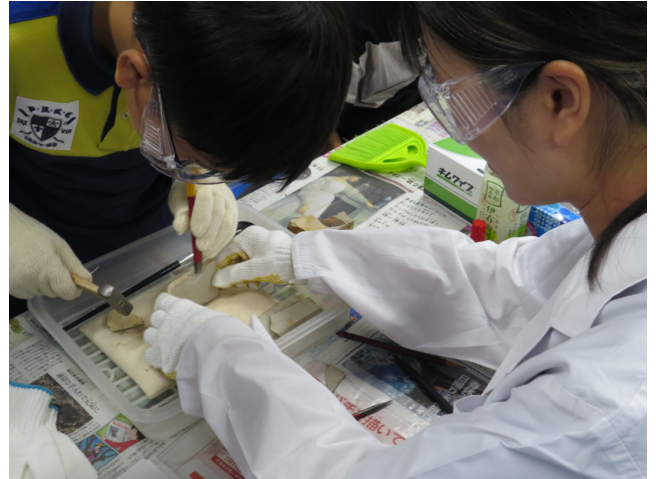
写真4 イベントの様子1。