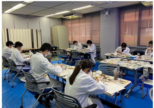
写真1 化石クリーニング練習の様子。

実習生はまず道具の扱いに慣れることから始め、化石原石をひたすら割って練習をします。使用する化石原石は、栃木県那須塩原市の「木の葉化石園」の葉理泥岩で、木の葉化石が多く含まれています。道具の取り扱い方、特に力加減に苦戦している実習生も見受けられましたが、何度も練習するうちにコツをつかみ上手く割ることができるようになったようです(写真1)。今回の練習に使用した化石原石からは、木の葉化石のみならず昆虫化石も多数発見され思