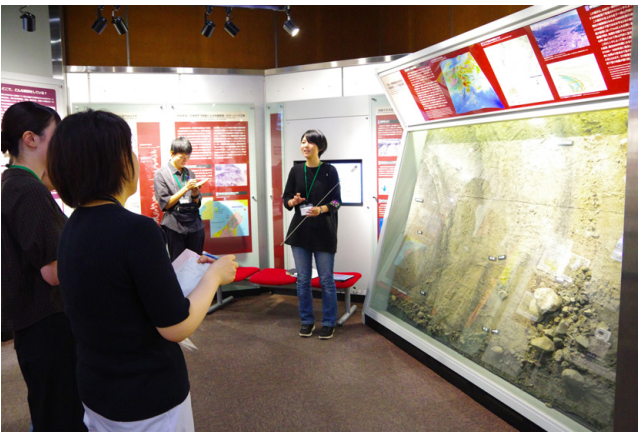
写真7 個人課題発表の様子2.

で、職員からも「今後の展示の参考にしたいアイデアがあった」等の感想が寄せられました。