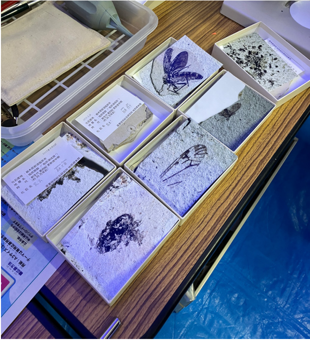
写真2 見つかった昆虫化石とその拡大写真。