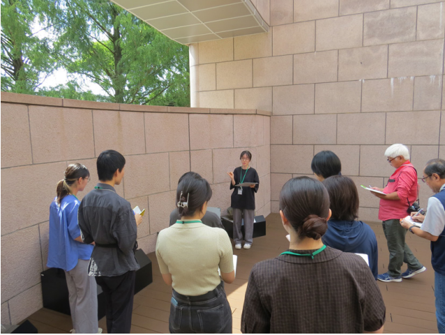
写真6 個人課題発表の様子1.