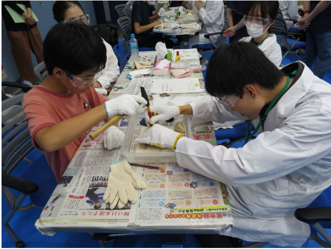
写真5 イベントの様子2.