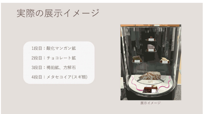
第4図 実習生考案の時節展示(冬)。