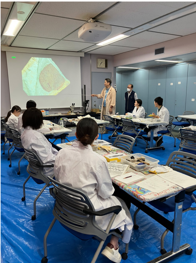
写真3 講師による指導の様子。

4人1組の2班に分かれ、第4展示室の岩石・鉱物棚の清掃を2日間行いました。職員から清掃方法のレクチャーを受け、まずは標本を展示ケースから慎重に取り出すところから開始です。ほとんどの実習生が標本を取り扱うのは初めてで緊張していましたが、実習生同士で連携を取りながら丁寧に作業を行っていました。実際に標本に触れてみ