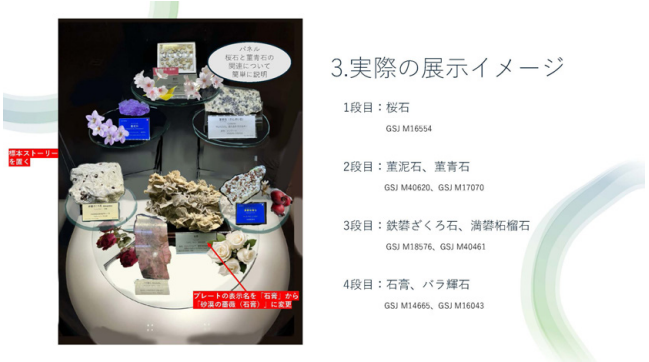
第1図 実習生考案の時節展示(春)。