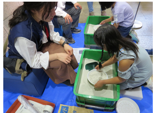
第5図 体験コーナー（砂変幻）の様子。

鳴り砂とは、海岸の砂浜を歩くと足元から「キュッ！」と音がする砂のことです(兼子, 2024; 兼子・齋藤, 2025)。これをワイングラスに入れて、木の棒で突くと簡単に鳴り砂の実験ができます(第4図)。ここで用いた鳴り砂は、福島県いわき市の豊間海岸のもので、実験に使用した砂をおみやげとしたところ、延べ101名の方がお持ち帰りに