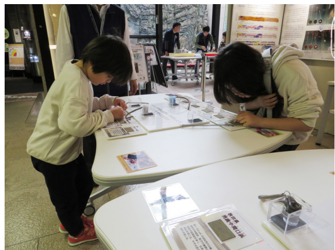
第7図 体験コーナー（砂観察）の様子。

兼子尚知(2024)地質情報展 2023 きょうと 体験・実験コーナー「鳴り砂」. GSJ地質ニュース, 13, 48-49.