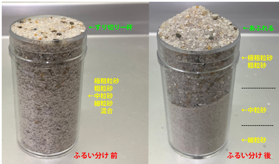
第6図 体験コーナー（砂のふるい分け）での、ふるい分け前後の嵩の違い。左：ふるい分け前，右：ふるい分け後。