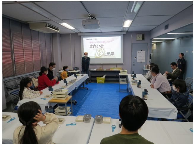
第1図 講師による砂解説の様子。

粒度表作りは、市販の珪砂を6段階に篩分けした泥～極粗粒砂を、細かいものから台紙に貼り付けます。完成した粒度表(第2図)を用いて、実体顕微鏡を使って砂や砂岩の粒子と大きさ比較を行いました。粒度の比較に使用した試料は、東京都新島村(新島)の羽伏浦、福島県いわき市の