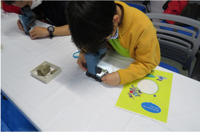
第3図 粒度表と試料を携帯型実体顕微鏡で比較する様子。