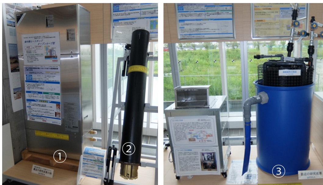
第5図 シーズ支援事業で製品化された高効率熱交換器