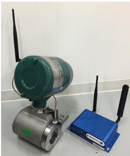
第2図 AI-IoT 温泉モニタリングシステム

熱発電の可能性調査を行うとともに研究開発ロードマップを策定し、グリーンイノベーション戦略やエネルギー基本計画等の政策へ反映させた。