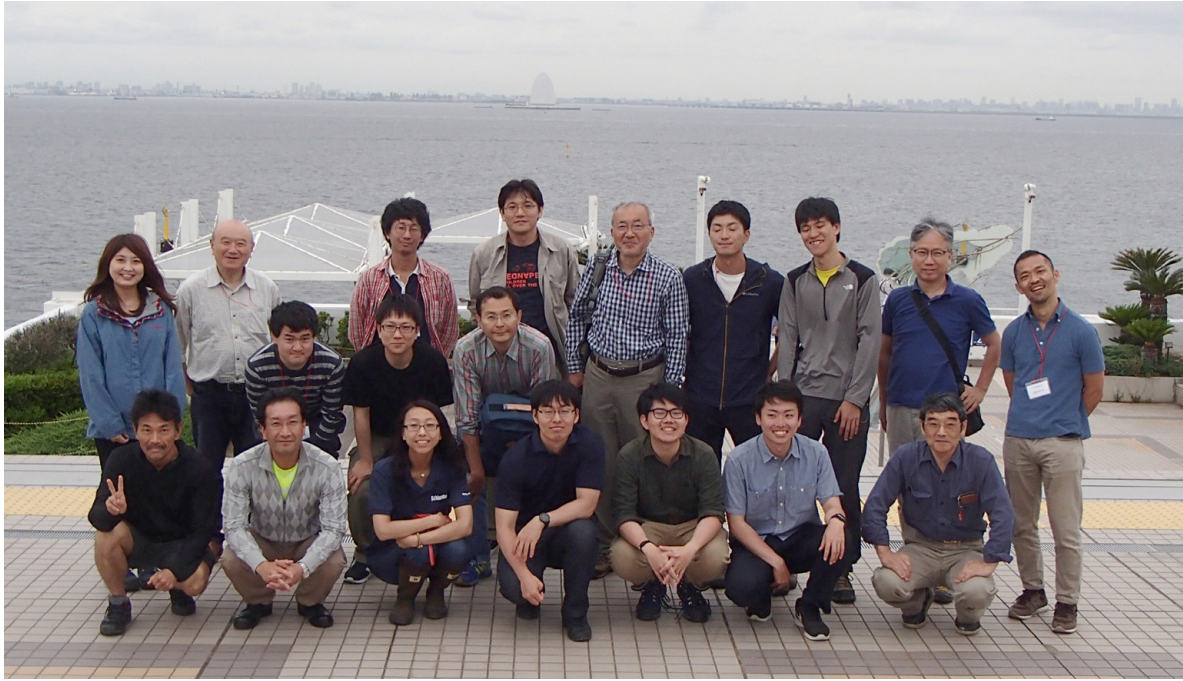
第 29 図 東京湾アクアラインの海ほたるにて記念撮影

を紹介するとともに、私が直接的・間接的に企画や準備に関わったものについて、その概要を表にまとめました。そしてそれらの中で、次回以降の特別見学会(地質編)の中で紹介する南関東ガス田での見学会とは内容をかなり異なるいくつかの見学会をユニークな見学会と位置づけ、それらの内容を紹介させていただきました。