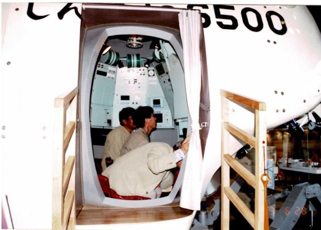
第20図 実物大模型の「しんかい6500」 中に入って疑似体験できます。