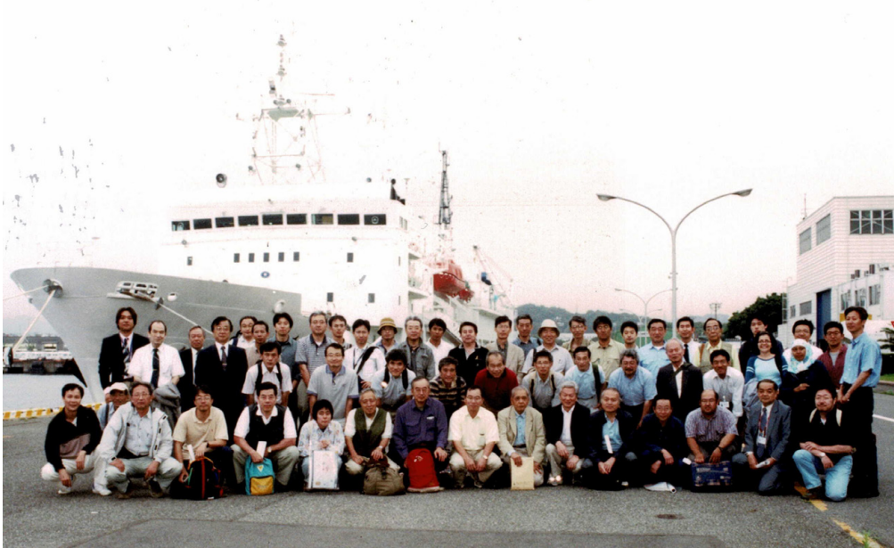
第24図 支援母船「よこすか」の前で記念撮影

掘削と実地訓練（慣熟訓練），2006年10月からの国際運行開始に向けて，艀装工事を始める準備を急ピッチで行っているところで，深部掘削技術関連の経験と情報が豊富な石油開発業界から，多くのベテラン技術者がこの地球深部探査センターに移籍，もしくは出向しておられました。当日，同センターの5人の方から，それぞれの担当分野の最近の状況説明があり，見学会参加者と質疑が行われましたが，そのうち3人の方は石油開発業界出身の方で，見学会参加者にとっては久しぶりの再会という方も多かったようです。