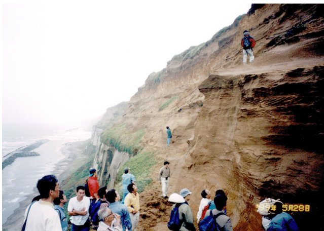
第6図 屏風ヶ浦の海食崖の上部を占める香取層(下総層群の木下層に相当)の見学風景

どのような形成環境の変遷が考えられるかを、伊藤先生による詳しい説明を聞いた上で観察しました。伊藤先生によると、この香取層には、海進・海退のサイクルが2度観察されるということで、その根拠とされる堆積構造とその上下の重なり方について参加者で確認しました(第6図)。