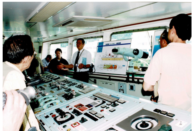
第22図 「よこすか」の操舵室での説明風景

生物の様子を写した珍しい映像を観賞させていただきました。その後2班に分かれて、「しんかい2000」や「しんかい6500」といった潜水調査船の見学とそれらの支援母船である「よこすか」の内部の見学を交互にさせていただきました。「しんかい2000」と「しんかい6500」の見学コースでは、潜水調査船整備場において、それらの実物を見学させていただきました(第19図)、その後近くの海洋科学技術館において、「しんかい6500」の実物大模型も見学しました。こちらは、見学者が中に入って潜水船内部の雰囲気を味わえるようになっており、3人一組で交互に中に入り船内の様子を疑似体験することができました(第20図)。また、潜水調査船の支援母船「よこすか」の見学コース(第21図)では、操舵室に入れていただき、そこで案内者の方から運行する際の苦労話のほか、いろんな話をお伺いすることができました(第22図)。