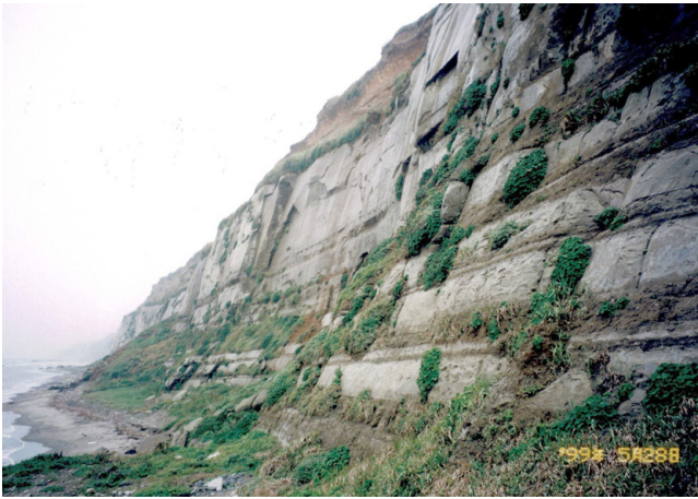
第5図 屏風ヶ浦の海食崖の下部を占める犬吠層群(ほぼ上総層群に相当)

第2見学地点である屏風ヶ浦海岸は、太平洋に面して約10 km にわたって延々と伸びる海食崖が有名で、海食崖に並行して伸びる防波堤(遊歩道)からみる海食崖の景観は見事で、東洋のドーバー海峡とも呼ばれています。この海食崖の下部には、約300万年前から90万年前(鮮新世後期から更新世前期)に形成された半固結状態の泥質岩層を主体とした犬吠層群(上総丘陵の上総層群にほぼ相当)とよばれる地層が、そして上部には、約13万年前～約2万年前(更新世後期)に形成された未固結の砂層からなる香取層(下総台地の下総層群木下層に相当)とよばれる地層が延々と分布している様子が観察されます。見学会では、まず海食崖下の遊歩道などから地層全体の景観を眺めました(第5図)。次に、上部の香取層を構成する砂層の堆積構造から