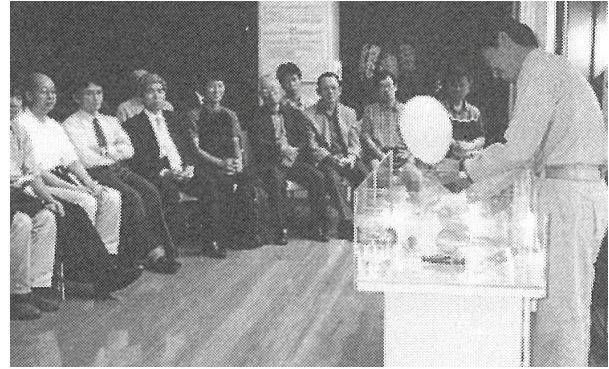
第 12 図 東京ガス(株)袖ヶ浦工場の LNG プラザでの実験風景 LNG(液化天然ガス)から気化したガスが風船を膨らませる実験。小田(2001)より引用。

2 時間半近く滞在した新日本製鐵(株)君津製鐵所を昼前に出発、今度は北上し、東京湾アクアラインに通じる自動車道の下を通り抜け、その北側の海岸沿いにある袖ヶ浦海浜公園に到着しました。ここで約 30 分の昼食タイムをとりました。この公園は、小櫃川デルタの北側の付け根付近に位置することから、西側方向では、東京湾アクアラインやその下にひろがる小櫃川デルタを目の当たりにすることができました。現在東京湾岸で埋め立てを免れた唯一デルタの形を残す小櫃川デルタは、きれいな円弧状の形態を示すことで知られるとともに、その周りには多くの潮干狩り会場や海苔の養殖・生産などで有名なところ。また