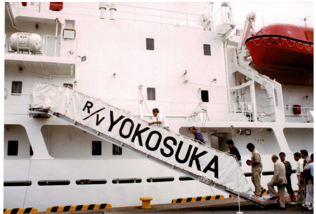
第21図 支援母船「よこすか」への乗船