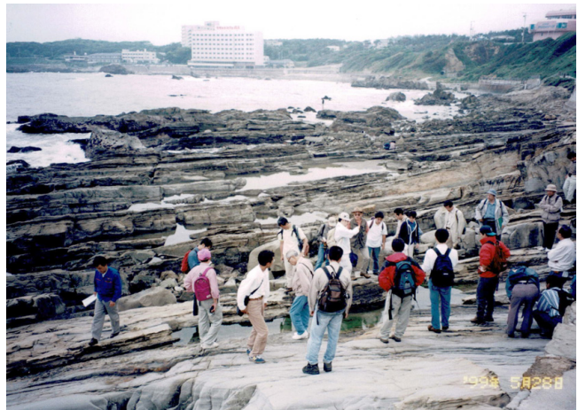
第3図 銚子層群犬吠埼層の観察風景 ハンモック状斜交層理などの堆積構造を有する砂岩層が幾重にも重なっています。