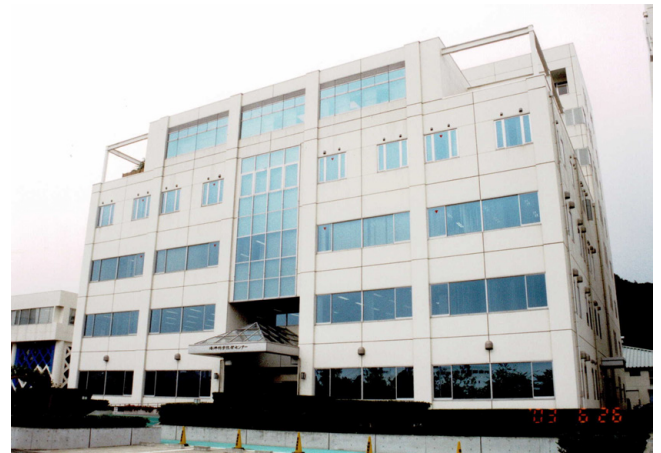
第18図 海洋科学技術センターの正面の建物(当時)