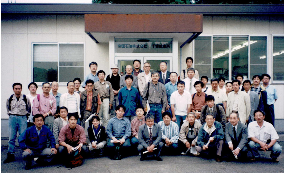
第10図 帝国石油(株)千葉営業所前での記念写真