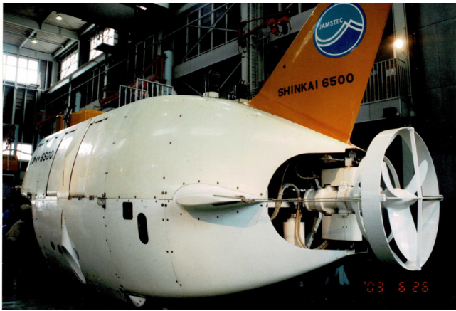
第19図 実物の「しんかい6500」