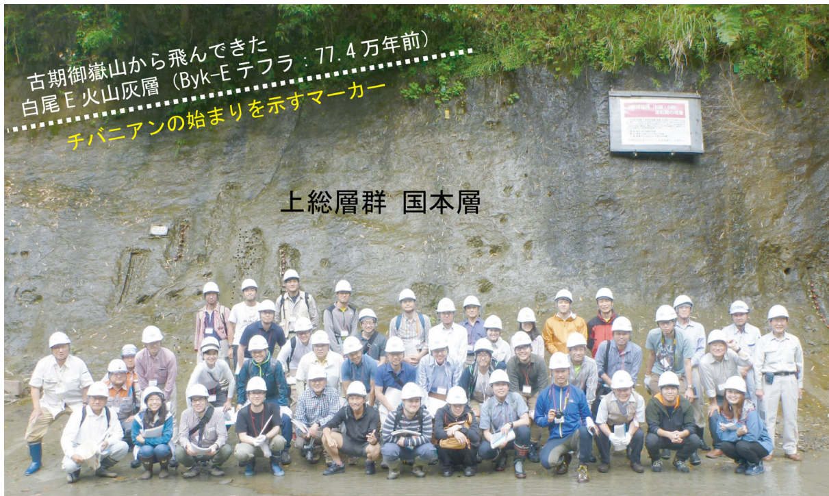
第 28 図 養老川沿いに露出するチバニアンの模式地(千葉セクション)の前で記念撮影 松山逆磁極期からブルン(ブリュンヌ)正磁極期への逆転層準は、白尾火山灰層の約 1.1 m 上位に設定されています(約 77.3 万年前)。

ンの模式地(千葉セクション)を、春季講演会後の見学会としては初めて見学しました。こちらは、市原市田淵の養老川沿いの崖に露出する上総層群上部の こくもとそう 国本層の一部にあたり、従来から松山逆磁極期からブルン(ブリュンヌ)正磁極期への変換を記録した地層(古地磁気逆転地層)として地図上にも表記されてきたところです。その後 2020 年 1 月には、世界の地質時代の名称にチバニアンという日本の地名由来の名称が初めて正式承認されその模式地がこの崖になったことから、この崖がさらに注目されることになりました(第 1 部第 21 図参照)。見学会では、チバニアンの基底(始まり)のマーカー(目印)となっている厚さ 1 cm 前後の薄い白色の火山灰層 びやくび (白尾 E 火山灰層あるいは Byk-E テフラ：約 77.4 万年前の古期御嶽山の噴火に由来する噴出物)を挟む地層をバックに記念写真を撮りました(第 28 図)。