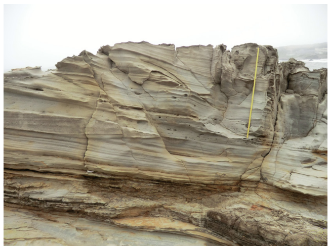
第4図 犬吠埼層のハンモック状斜交層理 折尺の長さは1m.