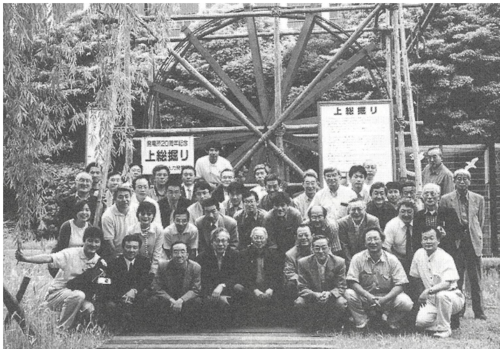
第14図 東京電力(株)袖ヶ浦火力発電所で保管されている実物の上総掘りの前での記念撮影 小田(2001)より引用。