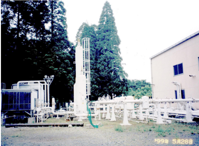
第8図 成東ガス田第1プラントのセパレーター 右手の建物の中にはコンプレッサーがあります。

第1部で、南関東ガス田での生産様式には、大局的に茂原型と通常型という2つのタイプがあることを紹介しましたが、成東ガス田地域では、浅層、深層のどちらで仕上げた場合も、ガス水比が長期間安定して理論ガス水比に近い2~3の低い値を示すいわゆる通常型の産出形態を示すということです。そこで揚水量を確保するために、掘削や仕上げには大口径のパイプを使い(第9図)、揚水動力として水中ポンプを使っているという説明がなされました。この場合の問題は、吸い込んだ砂粒子によるダメージ(ベアリングの摩耗など)、いわゆるサンドトラブルにより水中ポンプがいたみやすいことで、平均すると3~4年で交換しなければならないということでした。使用できなくなった水中ポンプが置いてありましたので、参考までに見せていただいた記憶が残っています。なお現在は、海外製の揚水ポンプを使っており、通常5年以上、場合によっては10年以上交換しなくてもよいということです。この揚水ポンプによってくみ上げられたガスとかん水はセパレーターで分離された後、ガスはコンプレッサーで圧縮されて販売元に送られ、一方のかん水はヨード工場に送られ、そこでヨウ素の濃集・分離が行われるということです。見学が一段落したところで、鉱業所前で記念撮影を行いました(第10図)。帰りのバスは、近くのJR成東駅に寄り希望者に降りていただいた後、JR千葉駅に向かい、午後5時過ぎに到着して解散となりました。