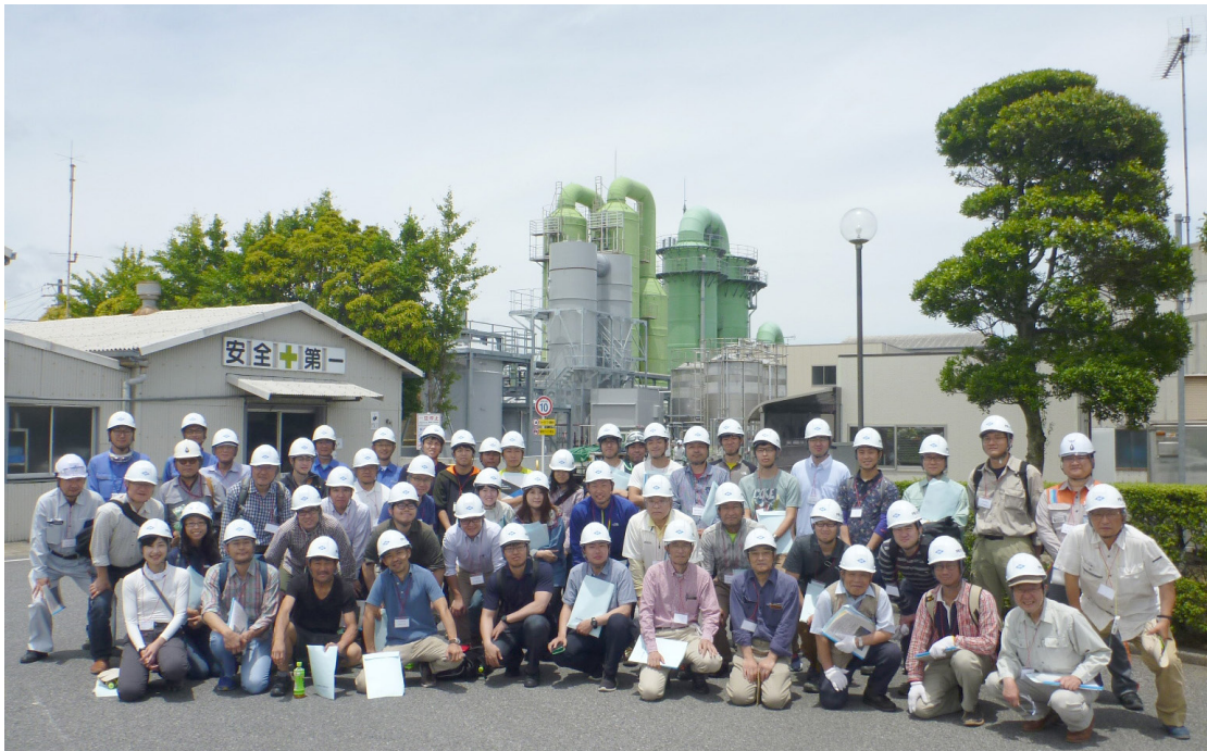
第 27 図 ヨウ素の生産施設をバックに記念撮影 伊勢化学工業(株)一宮工場にて。