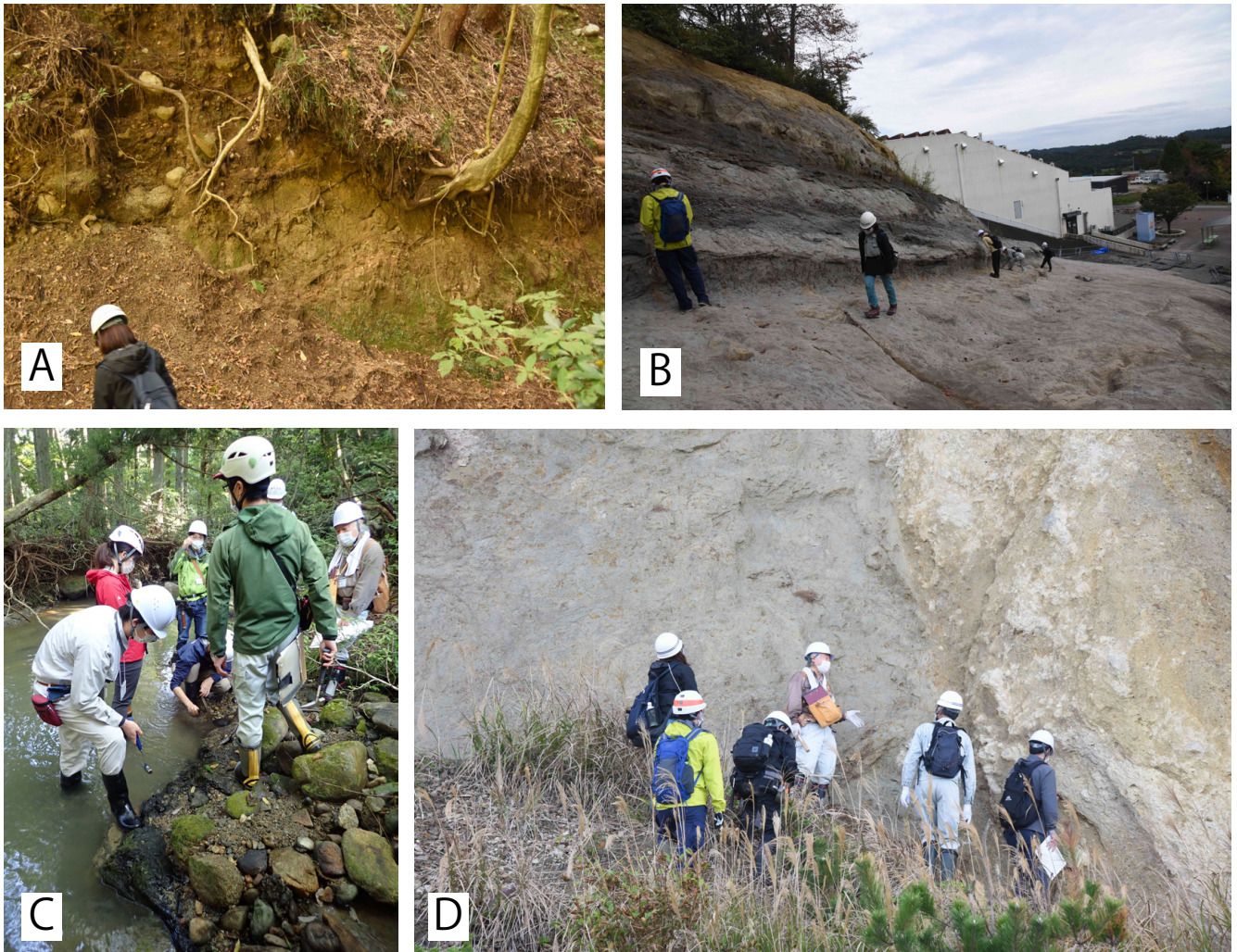
第8図 地史のまとめのための巡検の様子。

研修日5日目（野外実習最終日）。A：前期白亜紀の花崗岩類と双葉層群足沢層上浅見川部層（陸成層）の不整合露頭。B：いわき市アンモナイトセンターの発掘体験露頭（双葉層群足沢層大久川部層：海成層）。C：石城層に見られる石炭層（陸成層）の観察。D：新第三紀中新世の白土層群吉野谷層（陸成層）と1300万年隔てた鮮新世の仙台層群大年寺層（海成層）の不整合露頭（この露頭については野外実習初日の午後に観察）。野外実習最終日の露頭観察終了後に、現地でこの地域の地史（地質の変遷から読み取れる大地の変動履歴）のとりまとめを行った。