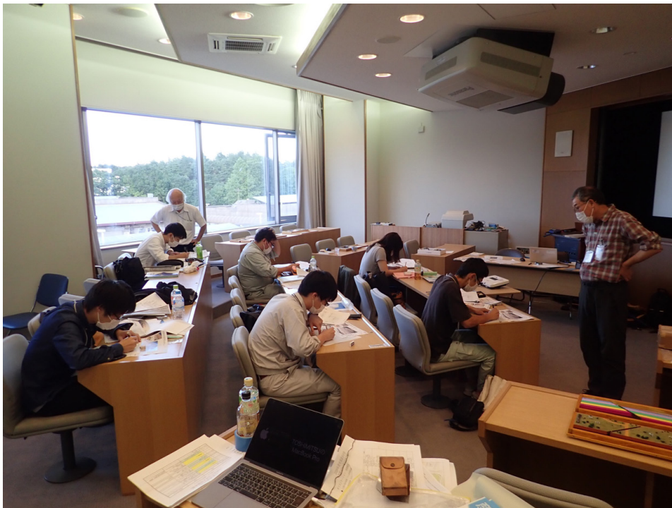
第1図 研修初日（座学初日）の柱状図作成演習の様子。

野外での地質調査の研修：茨城県ひたちなか市那珂湊海岸で後期白亜紀の那珂湊層群の地層観察と柱状図の作成（第4図）、福島県双葉郡広野町で新第三紀の1300万年ほどの時間間隙を持つ白土層群 しらど 吉野谷層 よしのや と仙台層群大年寺層の傾斜不整合および生痕化石の観察（第8図D）、いわき市久之浜町などで古第三紀の白水層群石城層の観察と走向傾斜の測定（第5図）、同市大久町 おおひさまち で石城層と後期白亜紀の双葉層群玉山層の不整合の説明など。夜のまとめ作業で、柱状図などの墨入れ後、昼間訪れた双葉層群と白水層群の不整合地点からの地層境界線の広がり の の予測図の作成