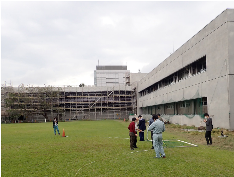
第3図 ルートマップ作成練習の様子。

研修初日（座学初日）。砂の粒径ごとに篩った砂を名刺大の台紙に貼り付けて粒度表を作成した。これを野外で堆積岩の横に置いて堆積岩構成粒子の粒径比較のために使用する。自分の調査に役立ててもらうため、このまま記念に持ち帰っていただくことを意図している。粒度表の作成ノウハウと材料等は地質標本館の提供による。