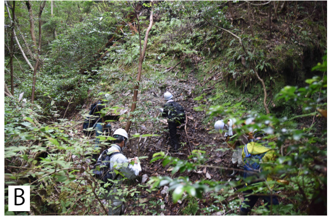
第6図 石城層と後期白亜紀双葉層群の不整合面の分布調査。

研修4日目（野外実習2日目）に、前日夜に予測した不整合面の広がり（不整合露頭分布地）を実際に見て回る。A：いわき市大久町の住宅脇にある空き地の崖での調査の様子（この写真は第1回での野外実習初日の時のもの）。B：いわき市大久町の日渡川の支流における調査の様子。