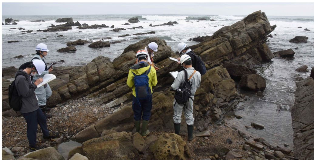
第4図 ひたちなか市那珂湊海岸での調査風景。

野外での地質調査の研修：いわき市アンモナイトセンター見学、広野町で白水層群石城層の中の石炭層の観察と断層露頭の観察、新第三紀の湯長谷層群 ゆながや 層平層凝灰岩の観察、双葉層群と基盤の花崗岩類(前期白亜紀)との不整合の観察など(第8図)。最後の研修地で研修調査地域の地史のまとめ。遅めの昼食後、受講証明書を参加者全員に贈