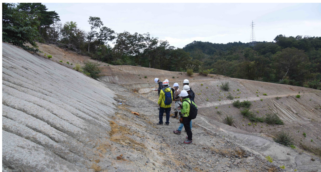
第5図 いわき市久之浜町での古第三紀石城層の観察。

研修3日目(野外実習初日)の午前。那珂湊海岸に露出する後期白亜紀の那珂湊層群を観察。固結した礫岩・砂岩・泥岩の互層が露出しており、実際の地層を見ながら走向傾斜の測定、柱状図の作成の実践を行う。地質調査の初心者にとっては、実際の地層でいきなり観察して記録をすることは難しかったようで、講師が一つ一つの地層を研修参加者と一緒にメジャー(折尺)で厚さを計測し、地層の情報を読み取りながら柱状図を作成した。