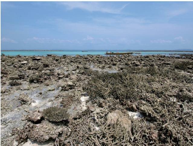
(c) 地震で干上がったサンゴ礁 その1.