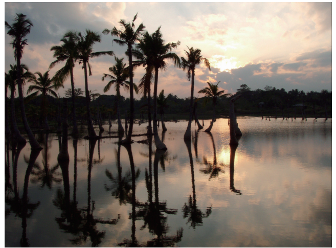
(b) 水浸しのココナッツ.