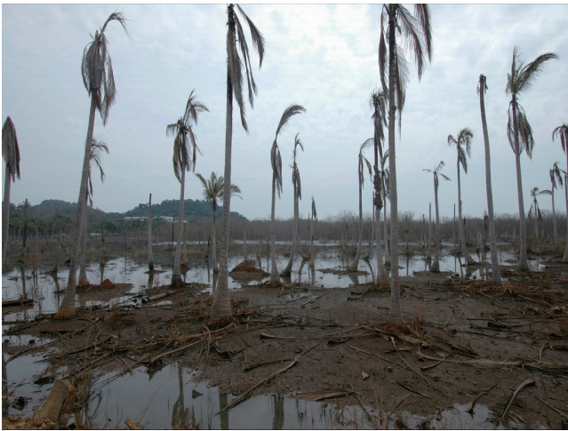
(a) 地震で死にゆくココナッツ.