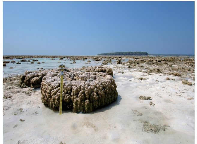
(d) 地震で干上がったサンゴ礁 その2.