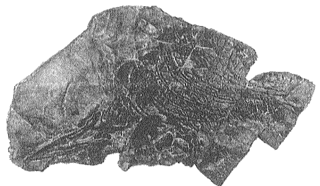
写真 Utatusaurus hatiai(ウタツギョリュウ)標本のレプリカ。宮城県歌津町産。東北大学所有。