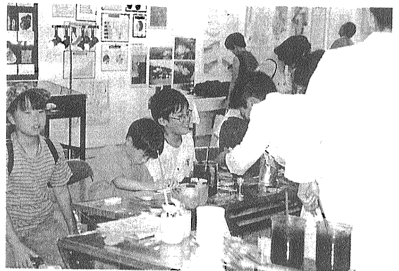
写真3 化石模型作成風景.

く立ち止まりました。また、活断層のはぎとりの展示は見る者を引き付けるものがありました。午後は報道機関も取材に訪れ、会場はごった返しました。