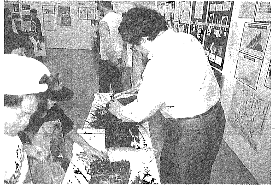
写真4 目を輝かせて石炭を割る子供達。

次の日本地質学会年会は信州大学松本キャンパスで本年9月25-27日に行われます。この機会を地質学の裾野を広げる絶好の機会ととらえて, 同様のイベントをやるよう準備を始めております。皆様のご協力をお願いいたします。