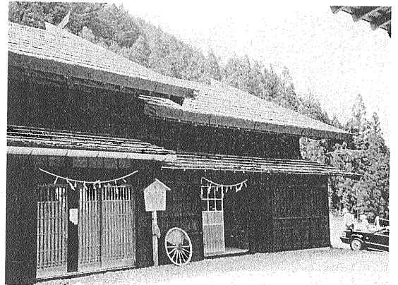
写真 3 ホウジ峠の「民俗文化伝承館」。江戸時代の民家を移築したもので、週末には郷土料理を提供。

近くにある露頭を整備し、領家帯と三波川帯の接触部が直接観察できるようにする予定である。