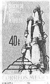
第7回 世界石油会議 記念切手