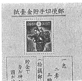
⑥ 郵便切手貯金台紙