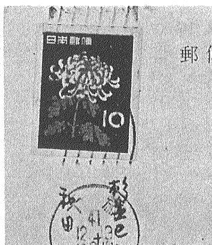
④ 簡易てがみの料額を切り取り使用したもの

日清戦争以降わが国は韓国および清国(中国)内に在留する邦人やわが国と文通する人々の便宜のために 諸外国と同様に わが国の郵便局と全く同じく郵便事務を行なう在外局を開設しましたが それらの局では 日本貨のほか韓国または中国の通貨で 等価(拾銭または老角をわが国の拾銭とする)で郵便切手を売りさばいたため わが国とそれらの国の貨幣価値の差(かわせ相場ではわが国通貨の方が価値があった)を利用して 在外局で現地通貨で切手を買入れ それをわが国に持ち込み