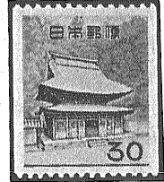
③ 最近のコイル切手 5円 10円 30円