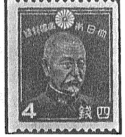
②戦前のコイル切手 ④田沢切手3銭 ⑤昭和切手5厘 4銭