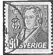
④ 外国コイル切手の例 2枚