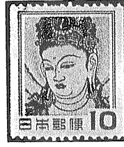
(1) 観音像切手 左 通常のもの 右 コイル切手