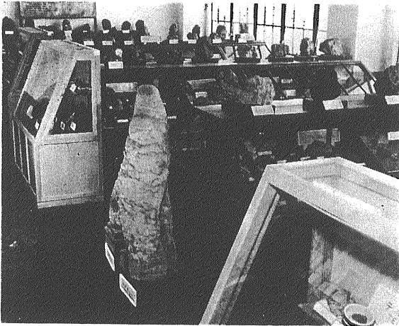
地質調査所標本室の一部

の構成物質 構造発達史を研究する学問であり 地球科学のなかでは最も古くから成立し 今日までその重要な分野をなしているものである。その後地球科学のなかで新しく発達してきた分野も多く その発達過程を通じ地質学ということばは色々な意味にとられている。