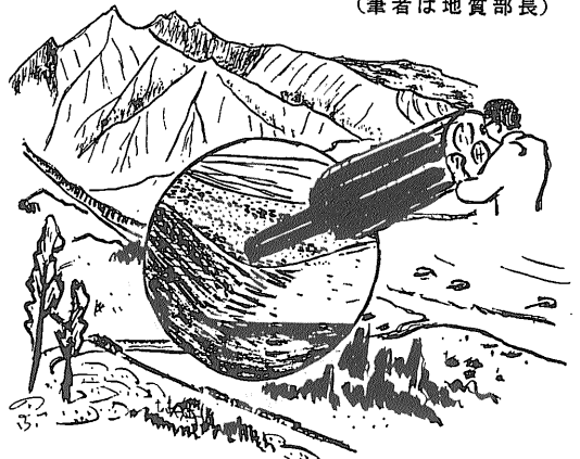
(え4) チェオ インサイド スコープ