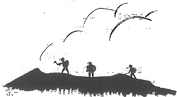
(え1) 山をいく地球のお医者たち

したがって、地球のお医者はずたいてい、足が強い。つまり歩くのが得意だというわけである。