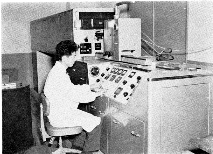
ジャコー エバート型3.4m平面格格子分光器

以上のほかに 工業用水課との協同による調査・研究燃料部との石油・炭田ガス・構造性ガス・地盤沈下などの協同研究 温泉の研究などの諸業務も実施している。今後も各部課と密接に連携をとりながら 地球化学の研究業務を行なう方針である。