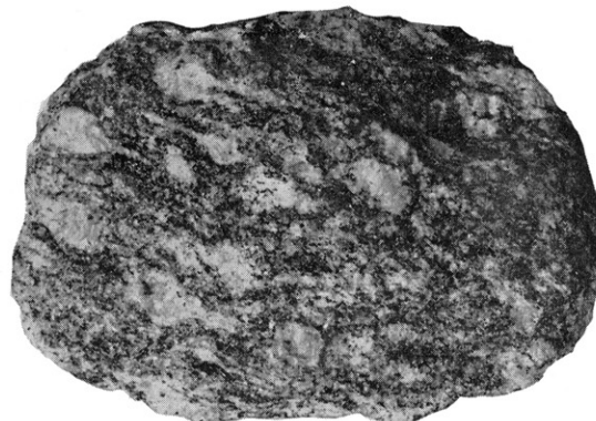
眼球片麻岩 (Augen Gneiss)