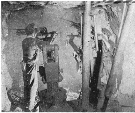
ジヤムポーによるさく孔