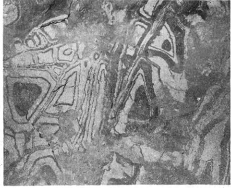
松尾鉾石のリーゼガング現象