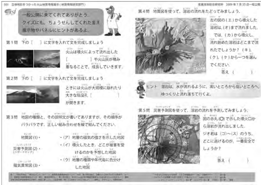
第3図 フィールドノートとして用いた問題(2009年度)。

り、胃腸炎、 ふしの 脳浮腫、肝・腎の脂肪変性などを起こすことが報告されており、頭痛、食欲不振、悪心、嘔吐、下痢、紅斑性皮膚炎、脱毛などの症状が現れることがある。特に小児では5～10gの おうと 嚥下で激しい嘔吐、下痢、ショックなどを起こし、死に至るとする報告がある」と記述されている。そのため、事故を未然に防ぐため、今回の実験にはグアガムと呼ばれる食品添加物(増粘剤)にも使われる天然素材(水溶性植物繊維)を原材料とする市販製品を用いた。