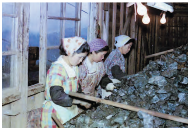
写真19. 若松鉱山の手選鉱場. 小塊鉱の選別作業の様子. 昭和50年頃.