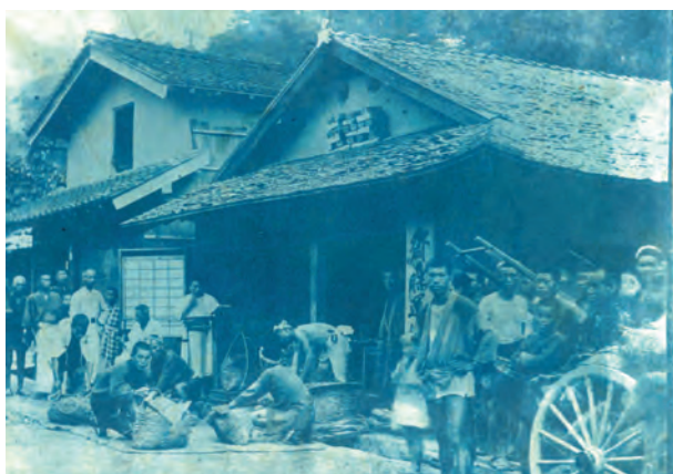
写真8. クロム鉱石の運送店の写真。齋藤運送店の看板がみえる。 かます 吠に鉱石を入れて秤量、そして大八車で搬出される(1905年(明治38年)頃)。