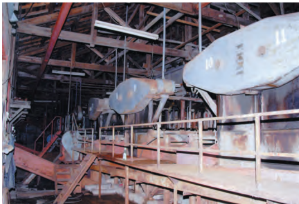
写真21. 機械選鉱場の写真。ほぼ現在の状況。比重選鉱機（ハルツジガー）11基が稼働していた。ここにも昨日まで稼働していたかのごとく機械の中に鉱石がそのまま残っている。