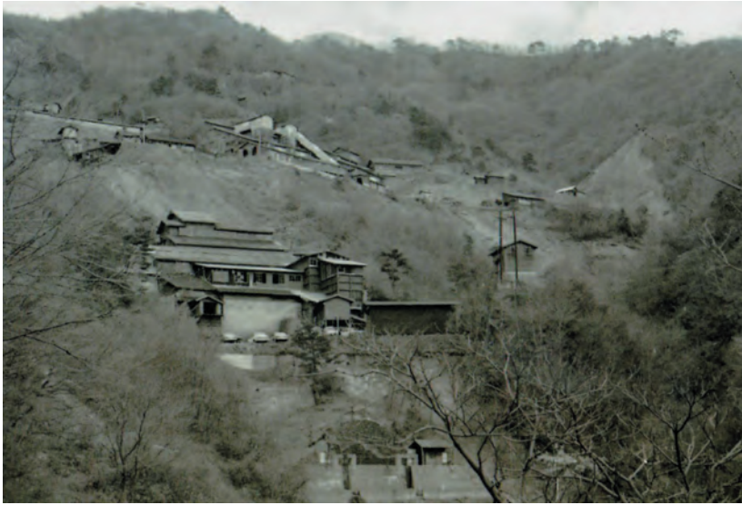
写真3. 1970年代(昭和50年頃)の若松鉱山施設の 全景。