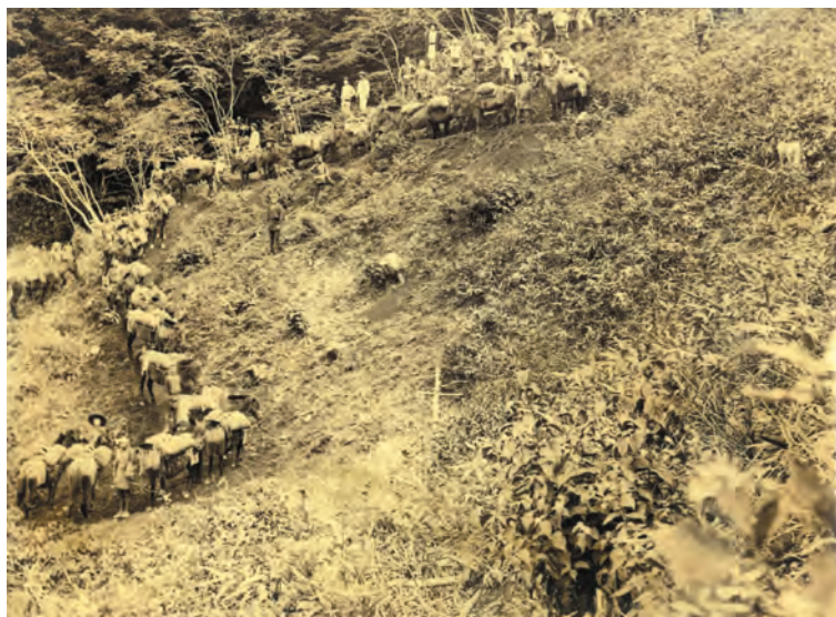
写真7. 明治の終わり頃の鉱石を運搬する写真。鉱石が大量に生産されるようになり、人の背から馬により運搬されるようになった。鉱石を麓の運送店まで運ぶ駄馬の行列である。現在も鉱山の区域内には馬道と称する道筋が残っている。