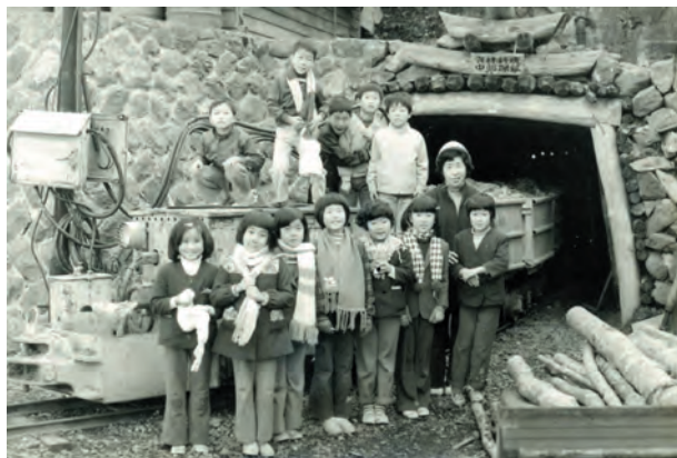
写真15. 昭和40年代の写真. 社会科見学の一環で若松鉱山施設を訪問する多里小学校の児童たち.