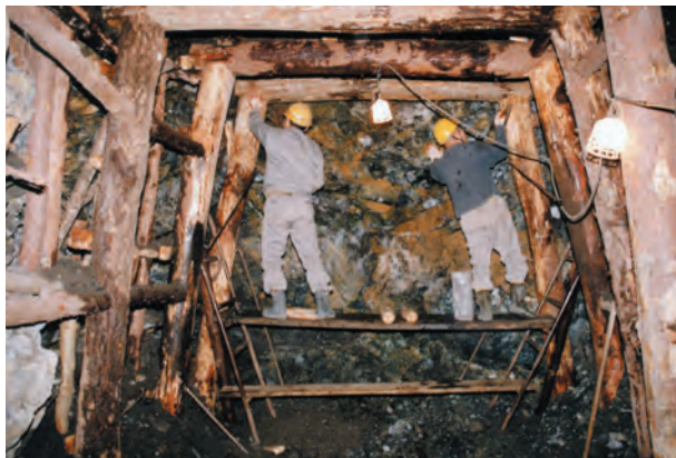
写真16. 若松鉱山の採掘切羽の施作作業風景. トップスライシング採掘法と呼ばれるもので, 若松鉱山ではこの方法がメインであった(昭和60年頃の写真).