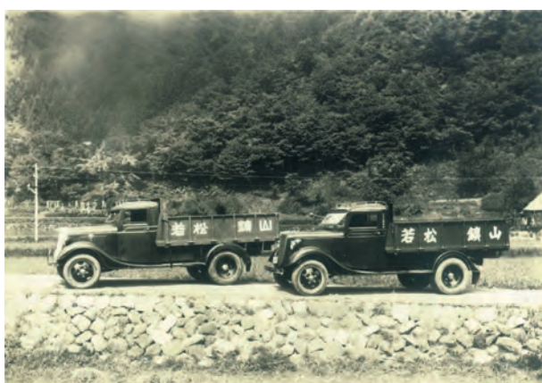
写真10. 昭和の初め頃の写真。輸送は、大八車から馬車へ、そして自動車へと変わっていった。これで輸送も随分と楽になったであろう。これで鉱石を国鉄生山駅(伯備線)まで運んだ。