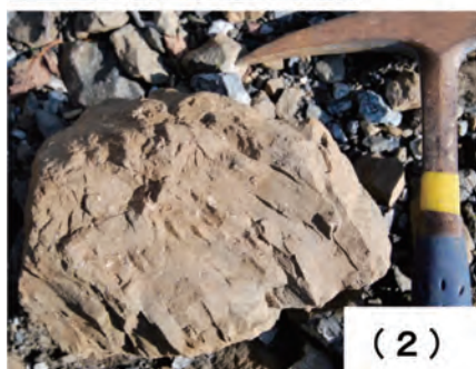
写真30. 蛇紋岩化したかんらん岩の写真。(1)ハルツパーガイトの岩塊。写真のように表面が風化すると, 初生岩石の識別がしやすくなる。淡褐色でスムーズな表面の部分が初生かんらん石が変質した部分で, 黒色に一部白色の光沢のみえる部分が, 輝石類が変質した部分。特に輝石類の変質した部分には, 二次的な滑石, かんらん石, 輝石類, 角閃石類, 等が生じていることが多い。(2)ダナイトの岩塊。写真のように表面の風化した部分はほぼ一様に淡褐色でスムーズな岩相を呈する。