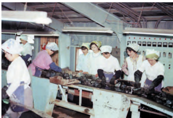
写真20. 広瀬鉱山の選鉱場. ベルトコンベアで流れてくる鉱石を, やはり手作業で選別している様子. この日, 若松鉱山から見学に行った時の写真. 昭和50年頃.