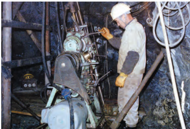
写真24. 坑内ボーリングの様子。昭和60年頃。クロム鉱山では、坑道にて丹念なボーリング調査によって、新たな鉱床や既存鉱床の連続を調べていた。ボディフォーム型クロム鉱床のボディとは、芋状もしくははさや状の形を表す。つまり、蛇紋岩中に突如として出現するクロム鉱床に対して、このような坑道でのボーリング調査が探鉱にとっては重要であった。