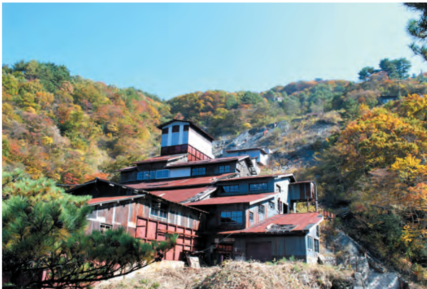
写真31. 現在の若松鉱山の様子。紅葉とともに赤色の屋根が美しい選鉱場の建屋であり、産業遺産としての今後の活用が期待される(2009年10月31日撮影)。