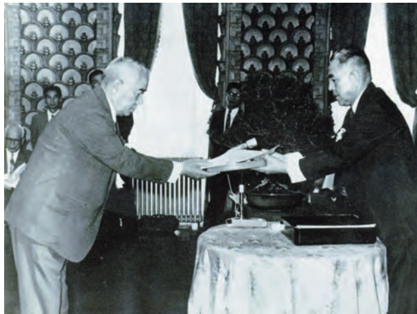
写真12. 昭和42年の内閣総理大臣表彰授与式の様子。長年の無災害を表彰されたものである。右は内閣総理大臣佐藤栄作氏、左は若松鉱山所長の野坂常雄氏。