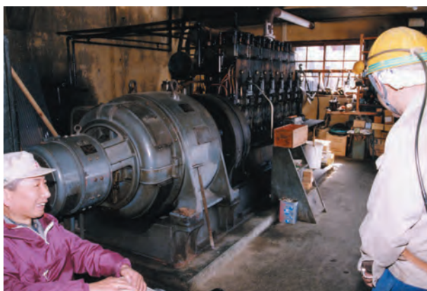
写真18. 若松鉱山の自家発電(ディーゼル)装置(180H, 150KVA)の写真. 1957年設置. 現在もほぼそのまま残っている. 昭和60年頃.