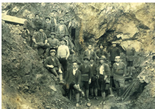
写真9. 若松鉱山第七号露天掘場(1931年(昭和6年)頃)。