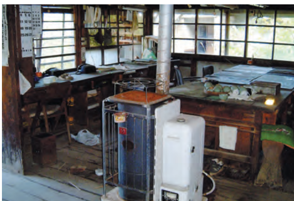
写真22. 現場事務所内部の写真。休山後の2007年の写真。ここも、茶碗や書類が残存し、休山少し前の事務所の様子が伺い知れる。