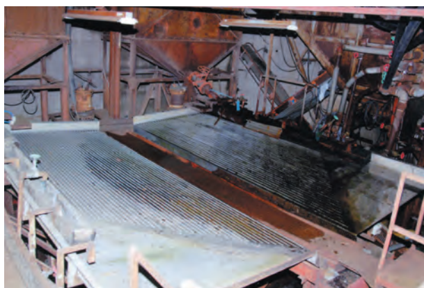
写真17. 若松鉱山のテーブル選鉱機(比重選鉱機, ウィルフレーターブル)の写真. ほぼ現在の風景であり, 選鉱機の上にはクロム鉄鉱が生々しく残存している様子が伺える.