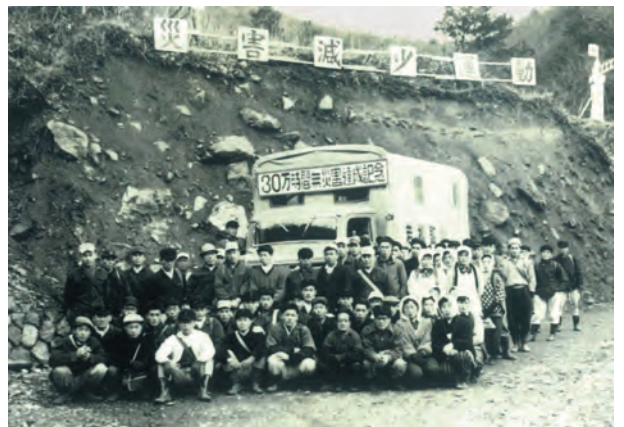
写真6. 無災害記録30万時間達成を喜ぶ従業員。後ろの自動車 は若松鉱山の通勤バスである(1959年(昭和34年)2月23 日達成)。