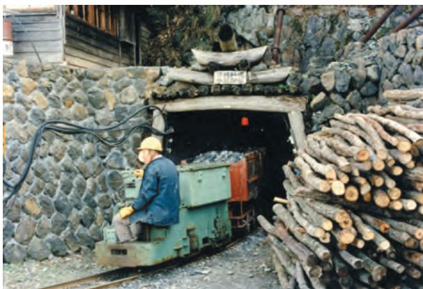
写真23. バッテリーロコ(2t)による鉱石の搬出風景(昭和60年頃)。現場事務所横の中部坑々口(標高773m)。坑口付近には沢山の支保用の坑木や矢木が積み上げられている。