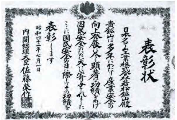
写真13. 写真12に同じ。内閣総理大臣からの表彰状。