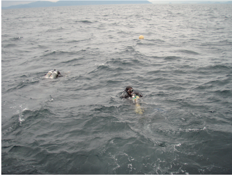
写真5(左): ダイバーの手作業による緑川沖海底面からの柱状試料の採泥作業。