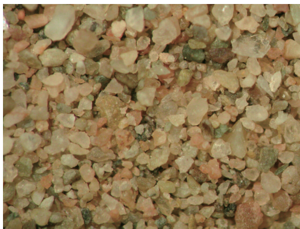
9. タリム盆地北部の砂 (SD-7).