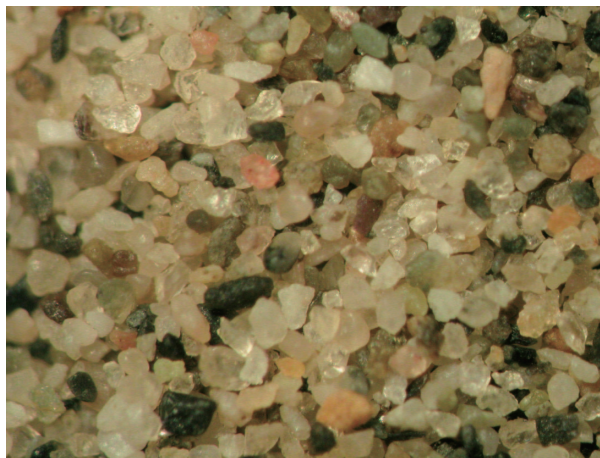
7. タリム盆地南西部の砂 (SD-13).

次に中国北西部・新疆ウイグル自治区のタリム盆地に広がる「タクラマカン砂漠」および近隣の砂の写真を紹介します。この地域の砂は、種々の鉱物片や岩石片が雑然と混ざっており、粒子の円磨度が低いのが特徴です。タリム盆地は周囲を氷河を頂く高山に囲まれ、夏季には多くの河川によって大量の土砂が運ばれてきます。そのためにこの砂漠の砂はつねに新しく付加され、砂漠の成熟度が低いと思われます(写真は全て左右4mm)。