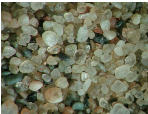
12. 敦煌西方砂漠の砂 (SD-39).