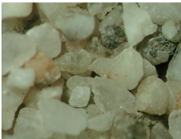
10. タリム盆地北縁部の砂 (SD-6).