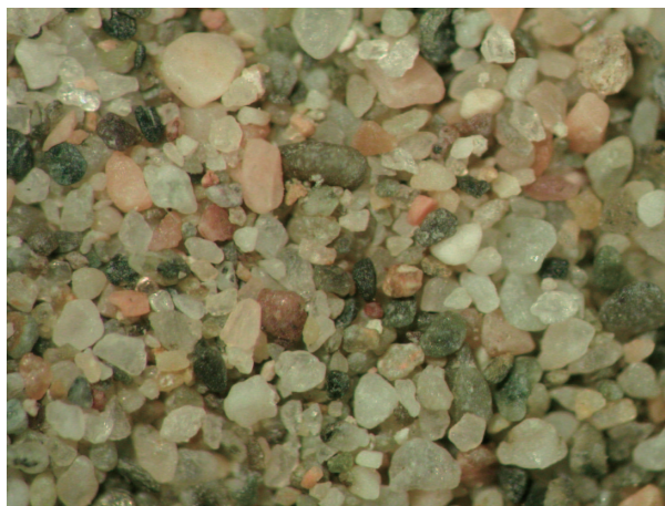
11. ジュンガル盆地北西部の砂 (SD-9).