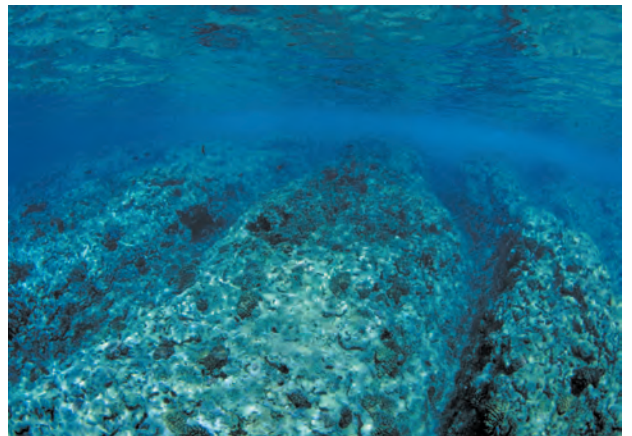
上：Majuro環礁南部の礁縁部と環礁外縁斜面の間の緩斜面で水中ボーリング調査を行った。(1999年9月撮影)