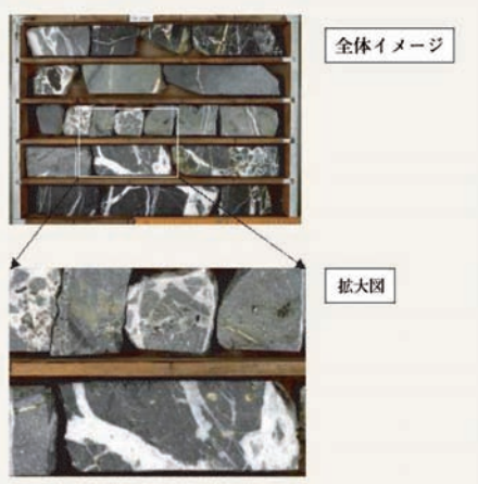
特殊な画像の一例(秋田県田沢湖町SN-3坑井から採取された充填鉱物脈)。