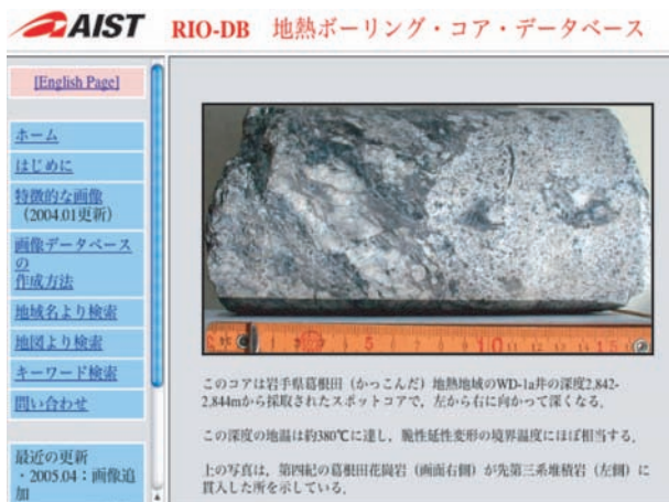
公開ホームページのホーム。