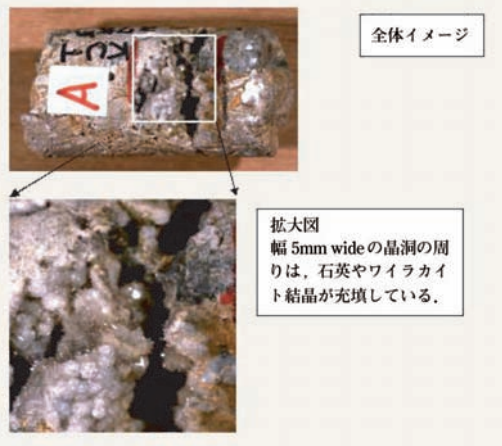
特徴的な画像の一例(秋田県湯沢市KU-1坑井から採取された開放系の熱水鉱物脈)。