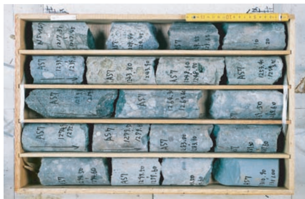
収納コアの一例(阿蘇カルデラ内の火山岩類)。