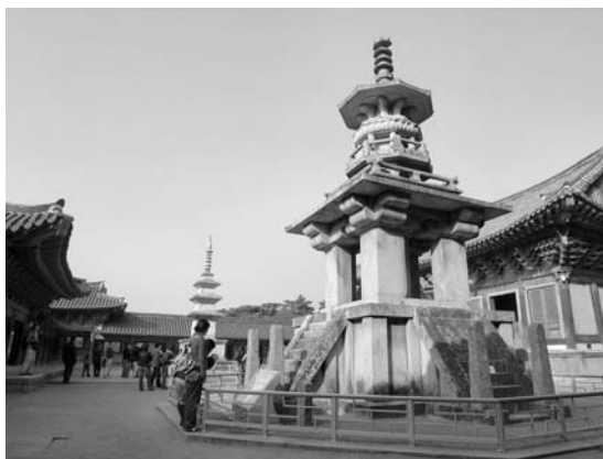
写真9 韓国でも有数の規模を誇るBulguk-sa(仏国寺)、世界遺産に登録されています。日本であれば木造で建てそうなところが、2つの塔が石造りなのがちょっとした違いです。