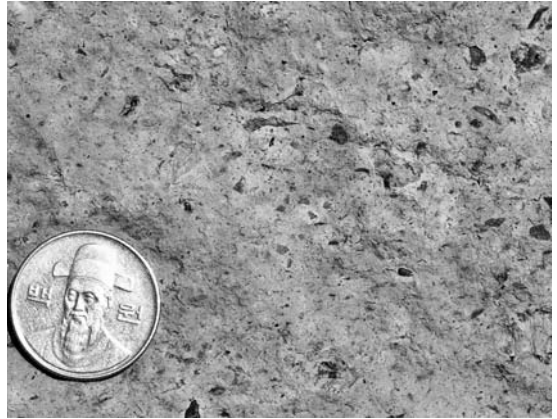
写真3 Haenam盆地に分布する厚い珪長質火砕岩. スケールの100ウォン硬貨はほぼ100円玉と同じサイズ.