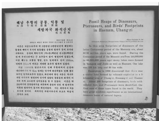
写真4 Haenam盆地, Uhang-ri(牛項里)に立つ恐竜化石産地を示す看板。