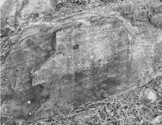
写真1 Yongdong盆地にみられる河川成の礫岩及び砂岩互層. 中央右寄りに左右対称的なトラフ斜交層理の断面が見えます.