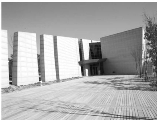
写真7 KIGAMに付属する地質博物館の入り口。この写真では全体が写っていないので分かりませんが、恐竜の骨格を模してデザインされたモダンな建築物です。