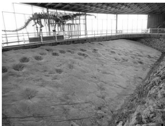
写真5 発見された恐竜の足跡化石は建物で覆われ、そのままの産状で保存されています。

Haenam盆地のUhang-ri(牛項里)では、露頭が立派な建物で保護され、一帯が公園として整備されていました(写真4~6)。今年(2006年)は恐竜博物館も開館する予定です。