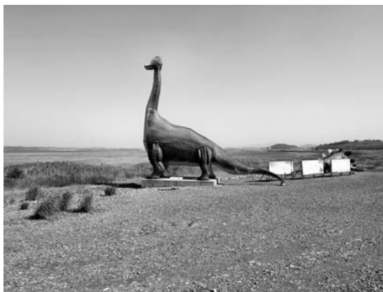
写真6 恐竜の实物大(?)の模型もありました。化石産地一帯は公園として整備されつつあります。