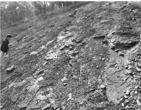
写真2 Yongdong盆地にみられる湖成の黑色泥岩. 植物化石片や乾裂などが観察されました.

に形成された堆積物であることをうかがわせます。珪長質火山岩は多くが大規模火砕流堆積物で、厚さが数100mに及ぶことも少なくありません。ときにカルデラを形成するような激しい噴火活動からできたと考えられています(写真3)。このような特徴は、西南日本に広く分布する後期白亜紀火山岩類の特徴と一致しています。ただし、韓国には活動中の火山がないためもあり、火山学的な調査・研究は日本ほど盛んではないようです。Haenam盆地で観察した印象では、岩相の変化が日本の同様の火山岩類よりも更に大きいように感じました。花崗岩類の分布面積を比較してもわかるように、韓国の特に西部では日本ほど削剝が進んでいないと考えられます。したがって、日本とは