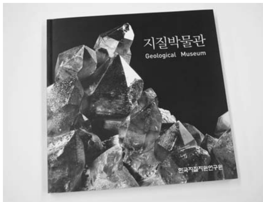
写真8 地質博物館の内容を紹介した本。フルカラーのうえ、165ページもある立派なつくりです。

更に、韓国でも地質や地球科学を一般に広く知ってもらうための試みとして、Geoparkや世界遺産登録の活動が始まっています。韓国内の世界遺産はまだ文化遺産のみで、自然遺産が登録されていません。有力なのはJeju(濟州)島だということで、現在2006年の登録を目指して申請中です。Jeju島は韓半島南西沖に浮かぶホットスポット火山で、全島がアルカリ玄武岩からなっています。また、韓半島とは風景や文化も少し趣向が違ってきます。面白いことに、火山岩しか分布しないこの島に、鍾乳洞が形成されている場所があります。Jeju島の溶岩は、粘性が小さく流れやすいため、溶岩洞窟が各所に残されています。その中のいくつかには、天井から成長してきた鍾乳石や床から成長してきた石筍が見られます。実は、この洞窟の上位には貝殻を多く含む砂層が堆積しており、その中にしみ込んだ雨水が地下水となるときに貝殻の石灰分を溶かして、下にある洞窟に鍾乳石を生成しているのです。世界でもあまり例がない珍しい現象だということです。