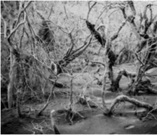
写真7 火山灰に覆われた森林。雲仙、地獄跡火口の南約600m地点。同地は後ほど、溶岩に覆われてしまいました。1991年5月10日撮影。