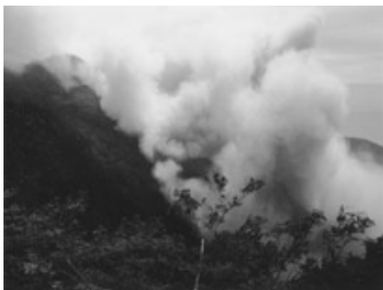
写真4 雲仙普賢岳の溶岩崩落による火砕流から発生した火山灰の雲。溶岩が写真の左上から右下に崩落し、火砕流が発生しました。この1分後、筆者らがいた地点は目も開けられない状態になります。1991年6月16日撮影。

には不明の点が残ります。「火山灰で幼児2人が窒息死」の記事はスープリエール火山(1979)にありました。1999年のエクアドルのグアグアピチンチャ火山の噴火では、老人が呼吸器系の問題のために死亡しましたが、新聞記事は見つかりませんでした。