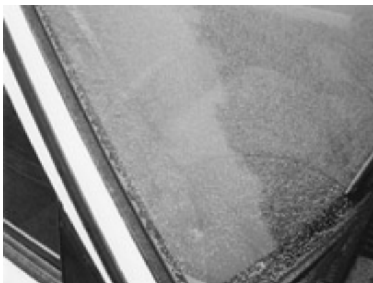
写真5 車のフロントガラスにたまった火山灰。写真4の灰がやってきたときには大騒ぎでしたが、たまった量はごくわずかです。

火山灰の熱で被害が出たような記事「茅部で降灰のため火災。」北海道駒ヶ岳1929、もありましたが、一般に雪のように降る降下火山灰の場合は、空気と接触することによって十分に冷やされます。写真4は、雲仙1991年噴火の最中の、火砕流から発生した火山灰がこちらに向かってくるところです。火口から約2km離れた道路で、山体変動観測のための光波測距作業中でした。どうなるか心配でしたが、この火山灰の雲に囲まれたときは、心もち暖かいという程度でした。このときの火山灰堆積量はごく少量でした(写真5)。厚く堆積した火山灰がなお