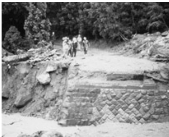
写真6 土石流により流された水無川にかかる平原橋、わずかの火山灰、わずかの降雨で土石流は発生しました。1991年5月19日撮影。