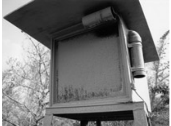
写真10 屋根をつけた自動連続光波測距システム。雲仙，野岳山頂。屋根をつけても，火山灰は垂直なガラスの表面に付いてしまいました。しかも，この後，都合の悪いことに，降水で洗い流されることがありませんでした。1992年6月19日撮影。

われ，うんざり顔は一日中晴れなかった。」桜島1982。「鹿児島市のデパートの屋上の配水管がつまり，雨水が1階にあふれ水浸しになった。」桜島1983。「市街地の降灰量は，2日夕からの分も含めると，1平方m当たり1.5キロ。1ミリほどの厚さで積もり，道路のセンターラインも見えなくなった。商店街の人通りも途絶えがち。経営者：開店休業だ。どこにも訴えようがないが，災害救助法を適用するなど救済策を考えてもらえないか。」桜島1984。「菊やラン，観葉植物などは灰で商品価値もガタ落ち。花市場課長：もうお手上げ。お客さんは動かないし，相場もふだんの2割は下落しています。」「鹿児島市。化粧品のセールスレディー：灰が入るからって門前払い。」以上，桜島1988。「観光客は降灰に早々に退散。」阿蘇1989。