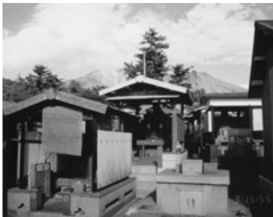
写真11 桜島の墓地。ご先祖様に灰がかからぬように屋根がかけてあります。後方が桜島火山です。2001年10月3日撮影。

灰活用で最優秀賞，農業発表大会，火山灰を生活にと題した発表。紙粘土人形，陶器用釉薬，磨き粉を考案。」雲仙1992。