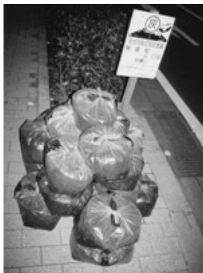
写真12 鹿児島市街地の降灰袋置き場。

「鹿児島市に新兵器，ストリートスイーパー，1時間に10キロ走り3.5トンを回収。」桜島1974。「ロードスイーパー6台，散水車8台が出動。4トンの吸引能力があり，平均1日は持つスイーパーも数時間で満タンになるほど。残業で夜遅くまで灰処理をしても，焼け石に水の感じだった。」「市役所が業者に委託して集める灰の量は1日約40トン。」以上，桜