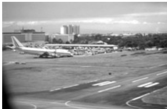
写真1 マニラ首都圏南部にあるニノイアキノ国際空港。この写真は1995年に撮影したもので、写っている事故機は、火山灰が原因のものではありません。

では、私たちの生活はどうなるのでしょうか。鹿児島市の人たちは、最近降灰が少ないのですが、少なくとも東京の住民よりは降灰の経験が多いので、火山灰が降ってくるとどうなるか、どうすればよいかを知っています。では、産業活動全体はどうなるのでしょうか。筆者は、工業技術院時代に、競争的特別研究のひとつとして、産業立地に関わる火山災害の影響評価およびリスクマネジメントというテーマで、1999年にこの問題を取り上げました。工業技術院の消滅とともに、このテーマも消滅したため、2001年からは、現在の鉄道建設・運輸施設整備支援機構の基礎研究の課題として、大都市における火山灰災害の影響予測評価に関する研究を立ち上げ、当所は火山灰のデータベース作成や火山灰分布予測図の作成などに取り組みました。火山灰の影響評価については、よその機関が担当しましたが、特に目新しい成果は得られませんでした。そのため、ここでは、新聞に報道された記事だけからどのようなことがわかるかを記します。