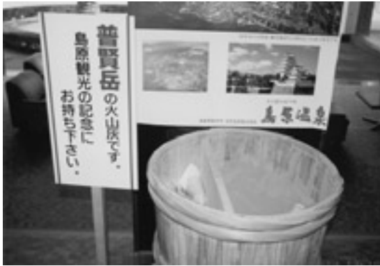
写真14. 火山灰を利用した観光宣伝。島原市のホテルのロビーにて、1994年3月11日撮影。