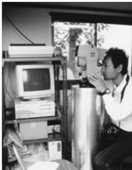
写真8 眉山観測のための自動連続光波測距システム。左の棚に、システム制御のためのパソコンが設置されています。1991年5月11日撮影。

一方、次の記事は、よく調べもしないで、憶測でしゃべった先生の話です。「ドイツの大衆紙ノイエプレッセは、シュツットガルト大学のシック教授の話