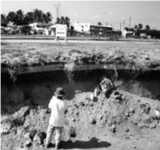
写真2 ピナツボ火山の東方約20kmの旧米軍クラーク基地における火山灰。地面の少し下の約20cmの白い層が1991年6月15日の火山灰です。1998年3月16日撮影。

この方法であれば、火山や災害の専門家でなくても、ある程度実態を取りまとめることが出来るため、ほかの種類の災害の調査にも適用できます。また、学生実習や、高校のクラブ活動などの課題としても取り上げられる方法です。