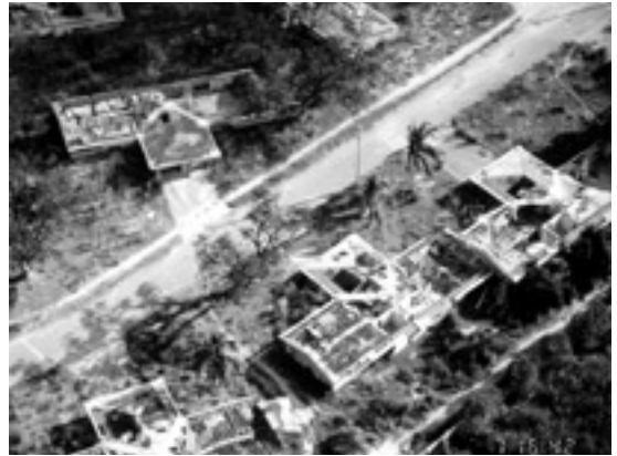
写真3 旧米軍クラーク基地の住宅跡。1995年2月7日撮影。

収集した新聞紙名は以下の通りです。以下本文では、いちいちこれらの新聞紙名を引用しません