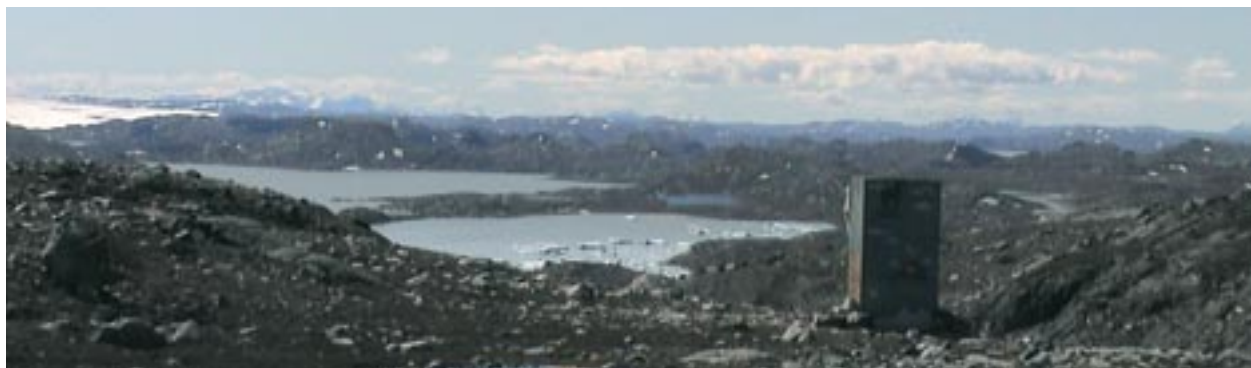
2. 東側から西側にかけて見たイスア地域。