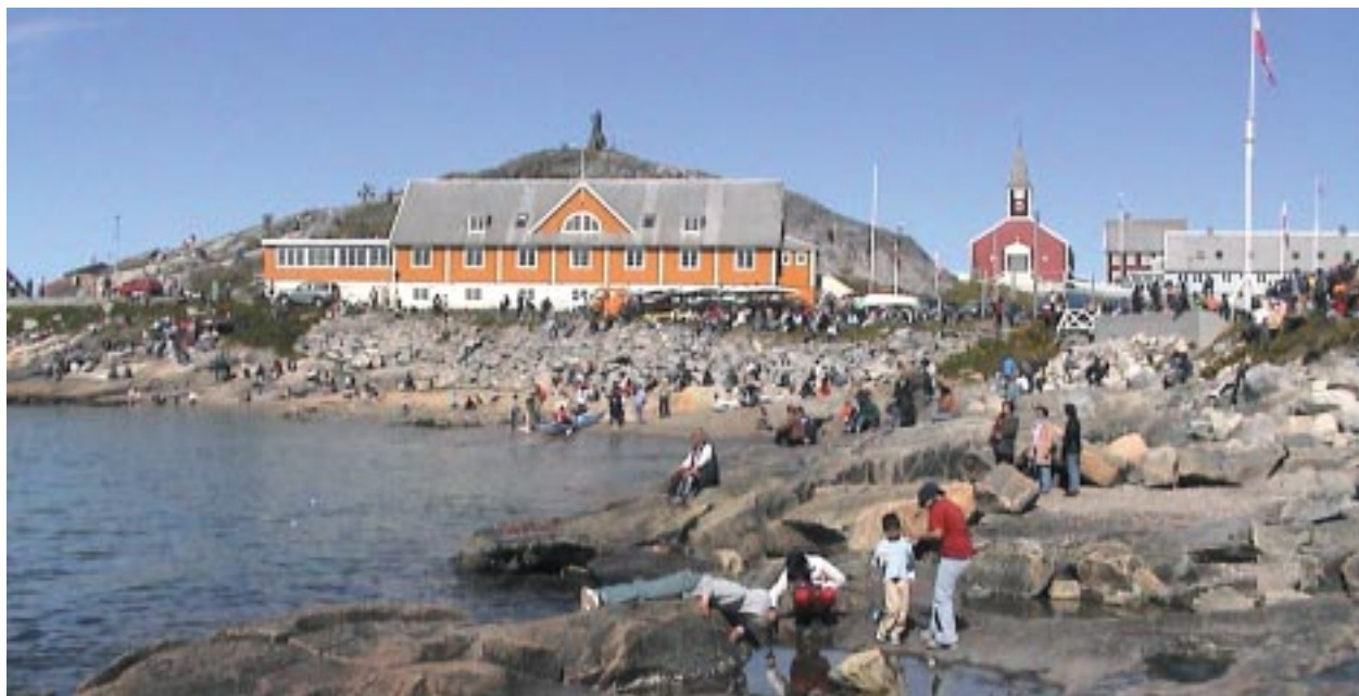
1. 首都、ヌーク北西部の海岸風景。