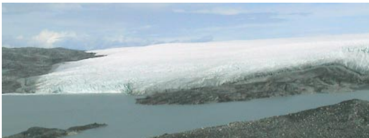
3. イスア地域を覆う大陸氷河。氷が割れる時は雷が鳴るような音がする。