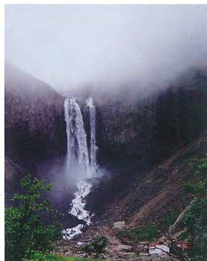
3. 長白山天池直下に見られる滝、長白瀑布。落差68m。侵食に強い溶岩流が急崖を形成。