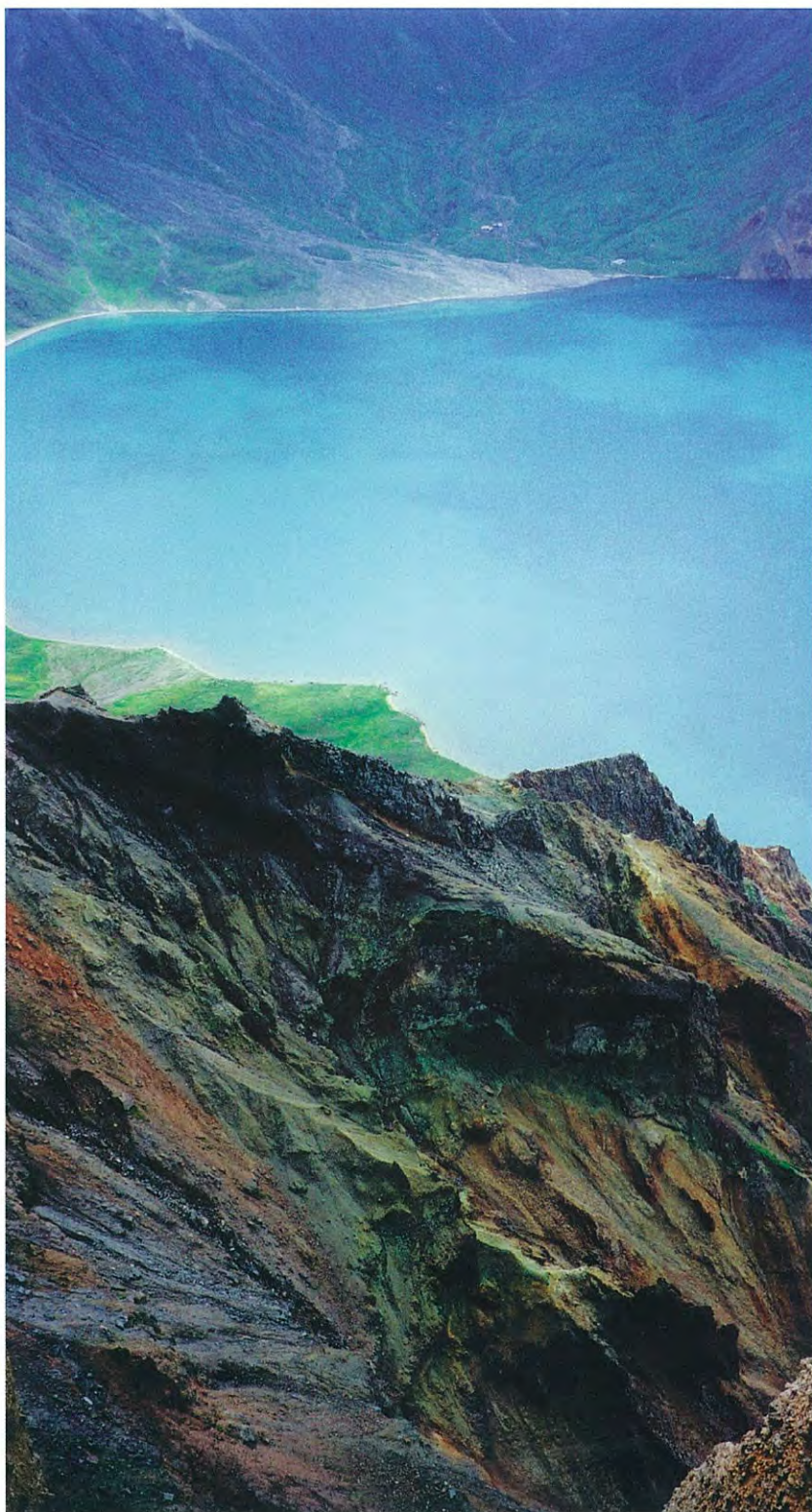
1. 山頂から北朝鮮側を見る。対岸の小さな建物は火山観測所といわれている。