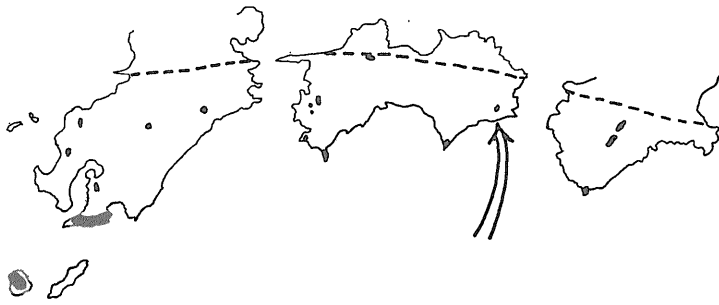
第1図 下雄閃緑岩の位置と西南日本外帯花崗岩の分布