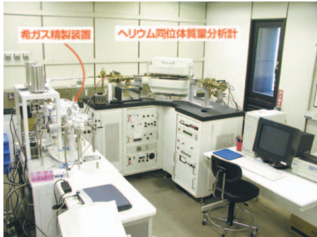
写真 ヘリウム同位体質量分析計

今回紹介した地下水年代推定法では、断層などを通して深部より上昇する熱水量も同時に見積もることができる。今後、表層から上部マントルに至る規模での固体地球内の水循環の解明につなげていきたい。