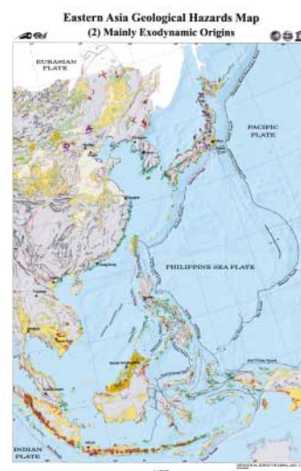
● 図：(左) 地震や火山などの内因性地質災害を表示 (右) 地滑り、海岸浸食などの外因性地質災害を表示