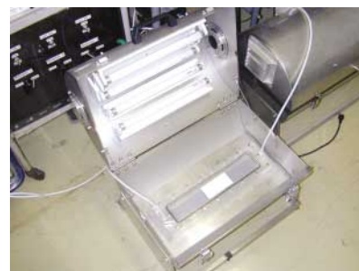
● 写真：光触媒の性能試験装置

光触媒に関する公的な標準としては、このTRが世界で初めてのものである。今後は、室内空気汚染の原因とされるホルムアルデヒド、トルエン等の、揮発性有機化合物 (VOC) の光触媒による分解除去能力の試験方法を標準化する予定である。