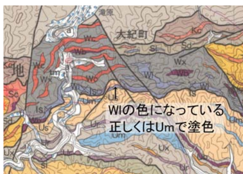
1) 図幅中央部、大紀町付近 Us に挟まれた Um が Wl の色で塗られています。Um の色で塗色すべき所です。