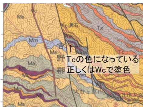
2) 図幅西部大台ヶ原山付近 Wx と接する Wc が Tc の色で塗られています。Wc の色で塗色すべき所です。